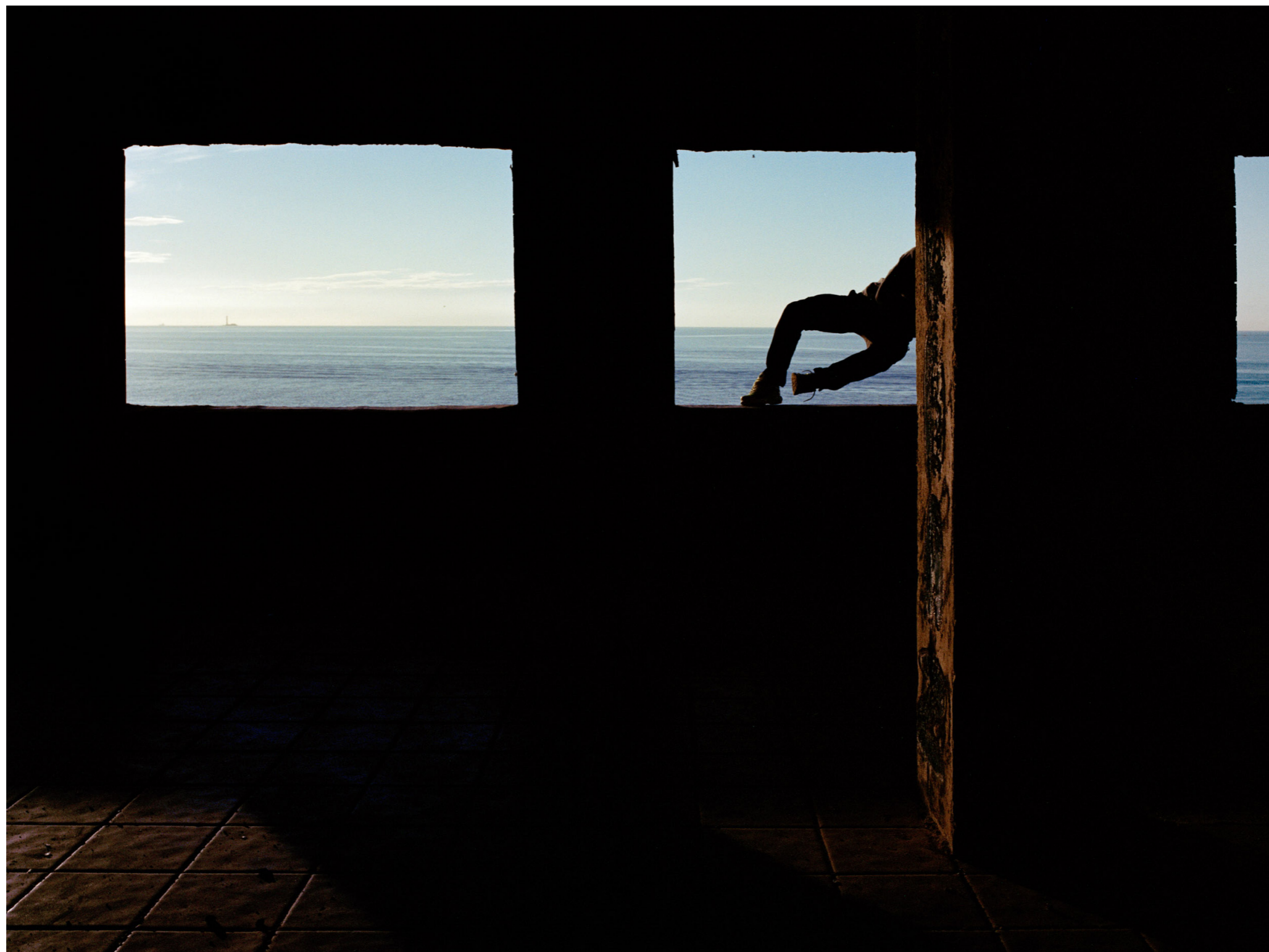
Lucas, Chemin des Goudes, 2023