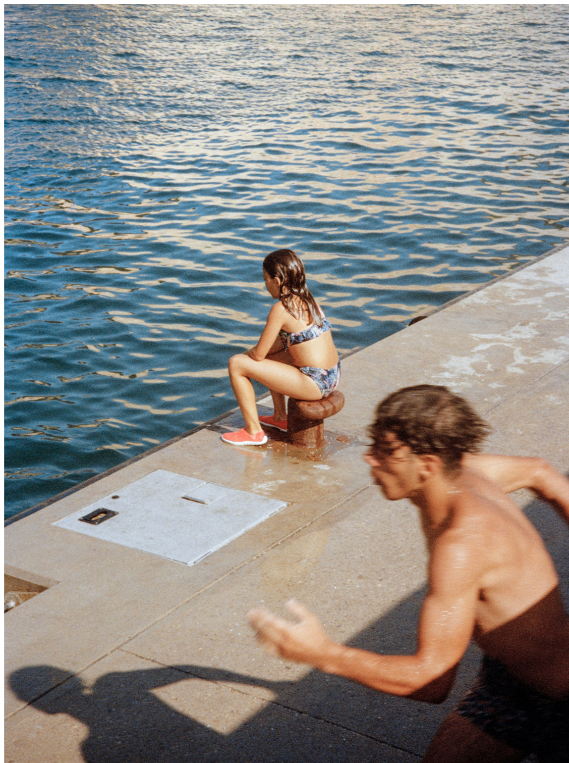
Mucem Port, 2023