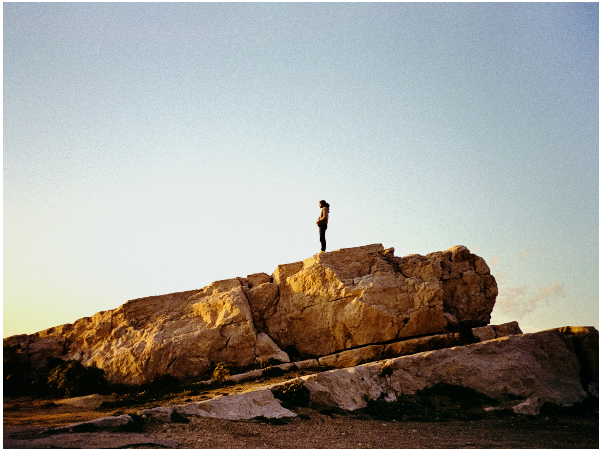
Lucas, Chemin des Goudes, 2023