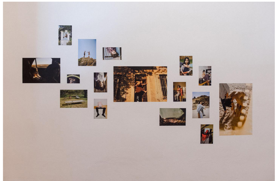
Vues d'expositions à Maupetit Côté Galerie Marseille 2022, Les Rencontres d'Arles 2022, Galerie Sit Down Paris 2023