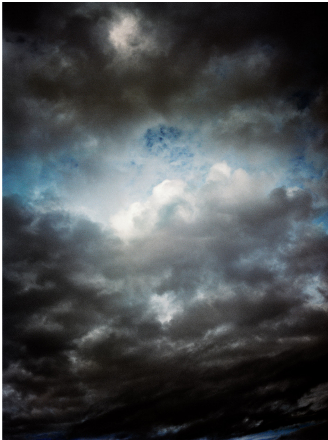
Sky of Les Goudes, 2023