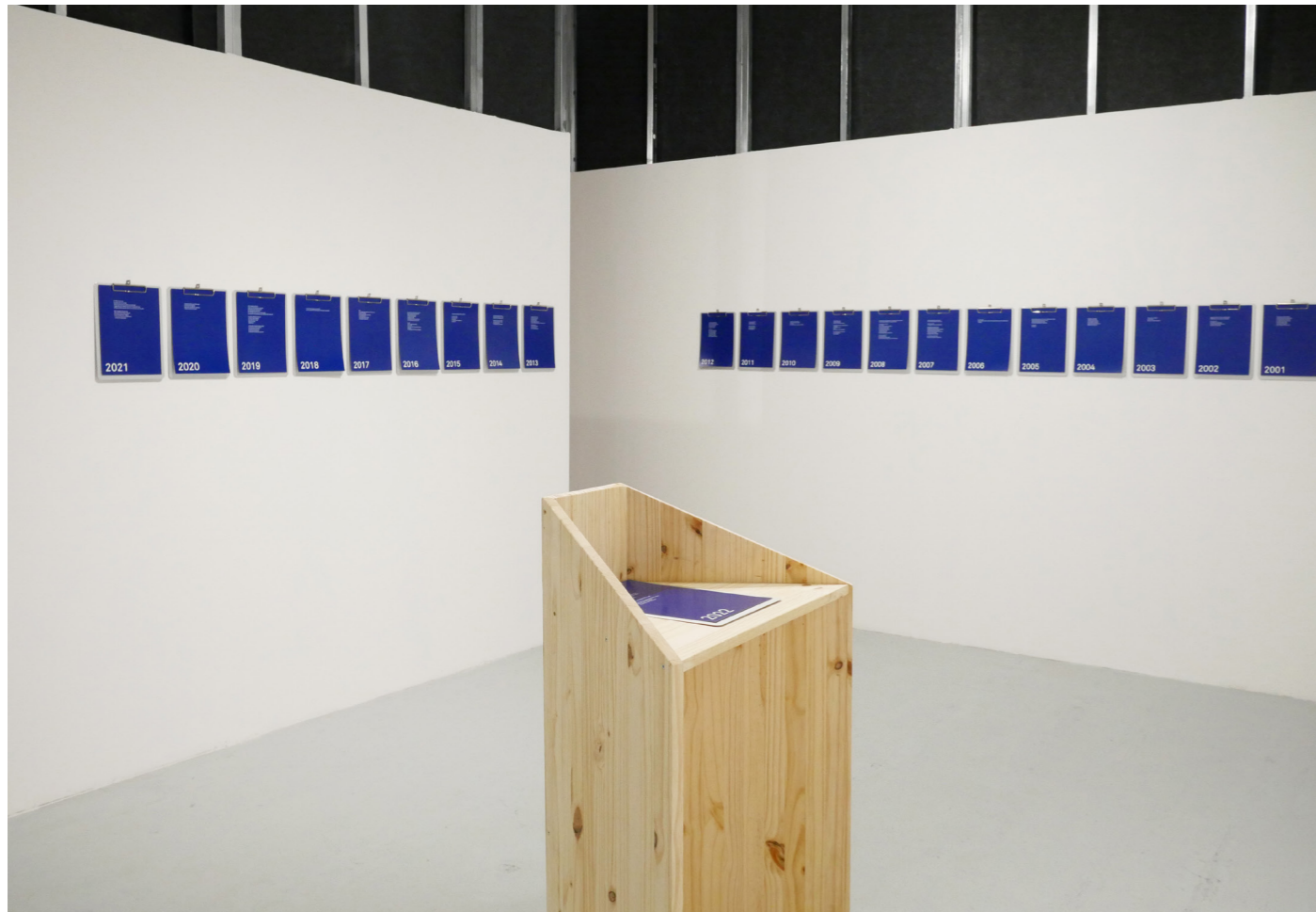
La Relève IV, Château de Servières, Festival parallèle, 2022