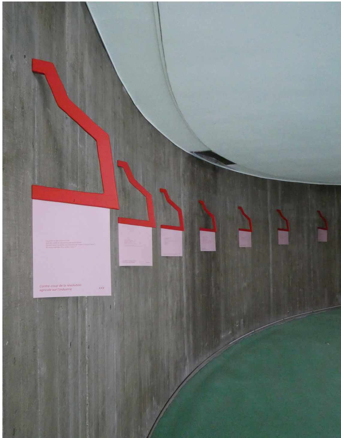
La langue des oiseaux, Jeune création, Espace Niemeyer, siège du PCF, 2022