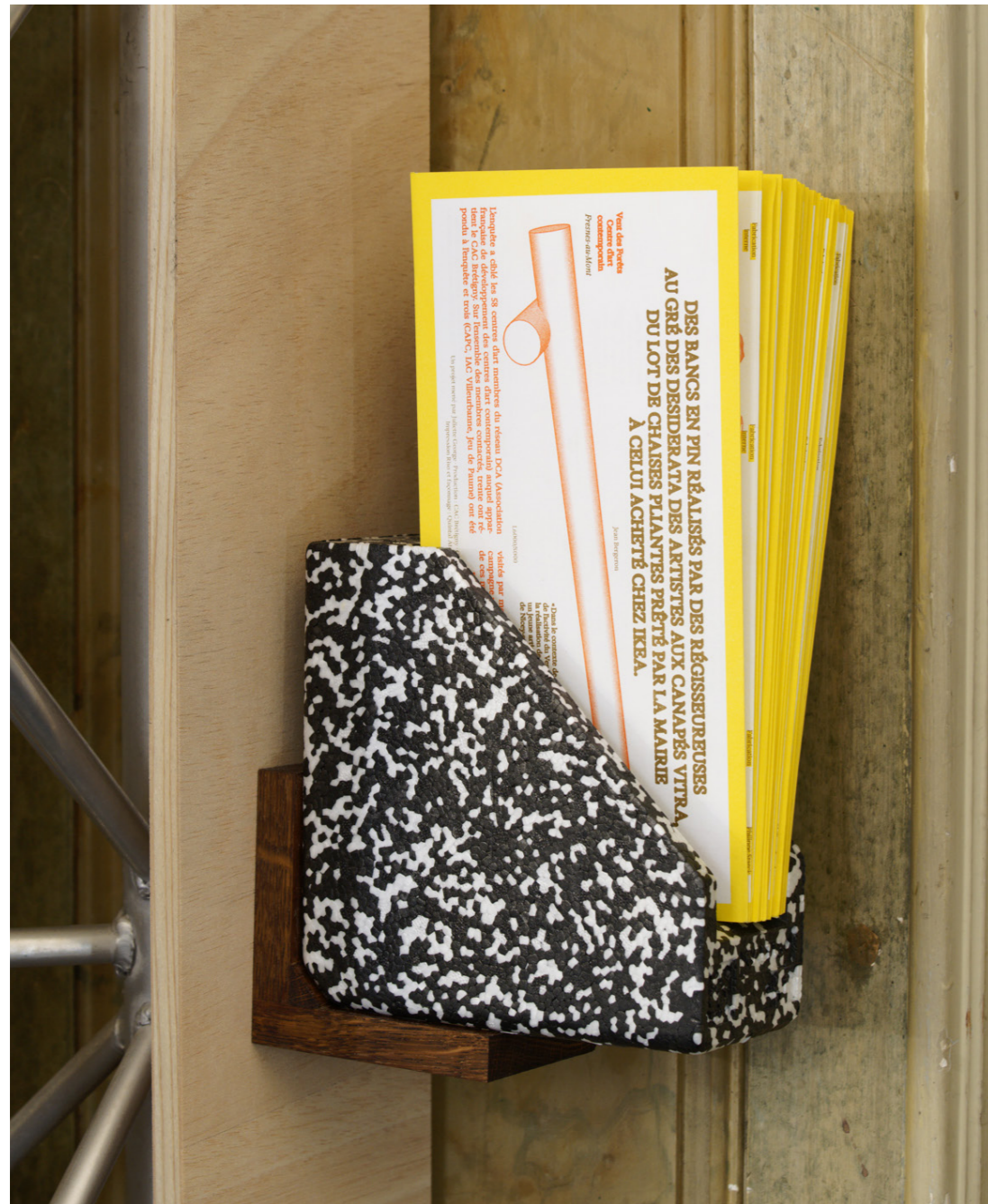
©Vues de l'exposition «Entrée libre», Commissariat: Équipe du CAC Brétigny. Photos: Pauline Assathiany. x blankett