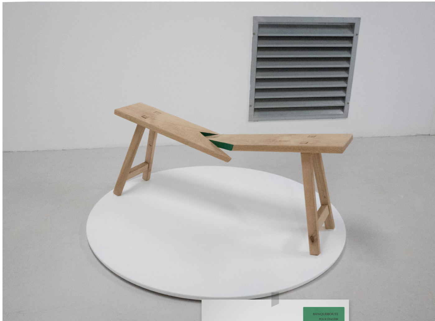
72e festival de Jeune création, 2022 miniature, Bien à vous, Fondation Pernod Ricard, 2022