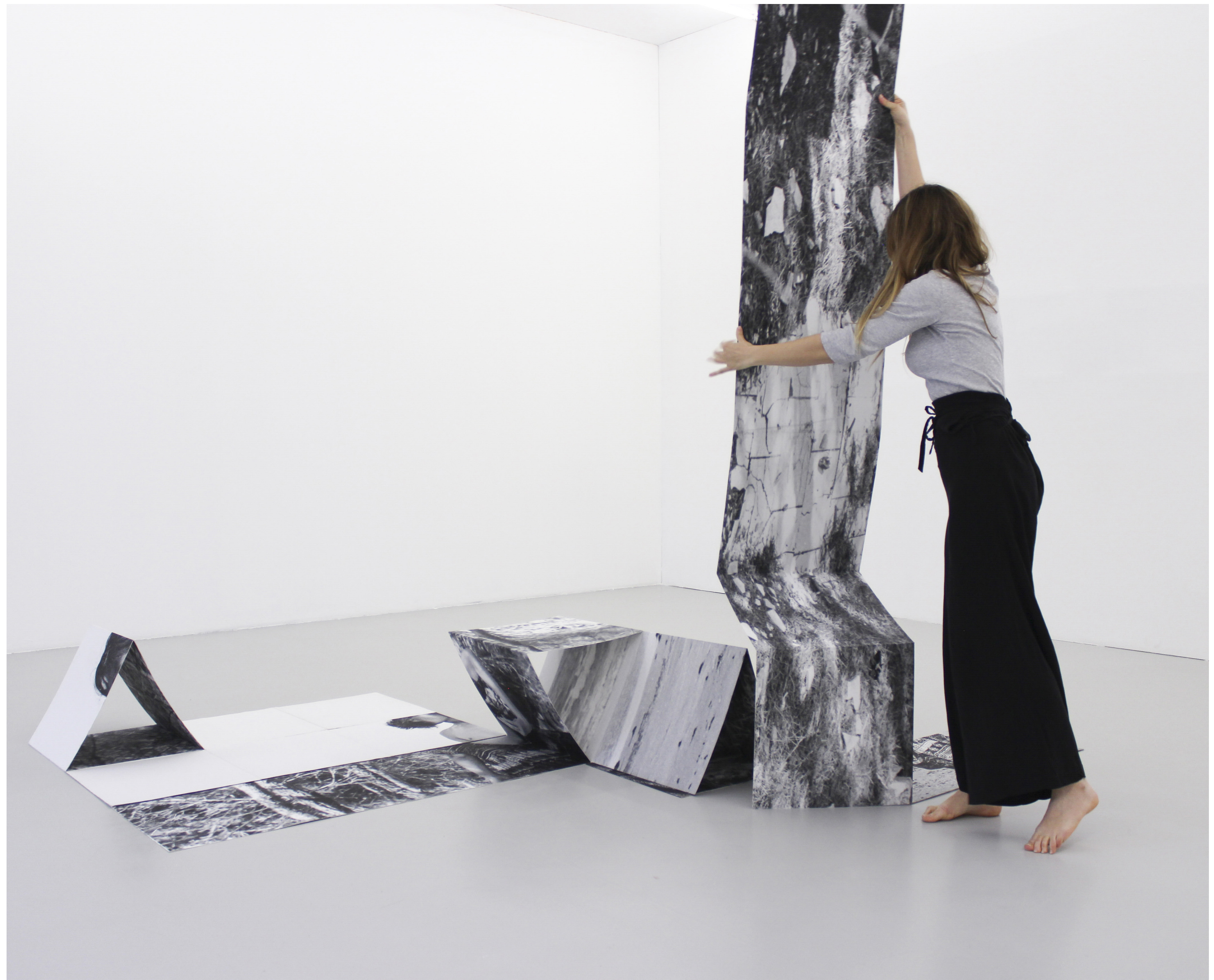
Fold, installation, 2020 vue d'exposition à L'Espace de l'Art Concret, Mouans-Sartoux, 2022