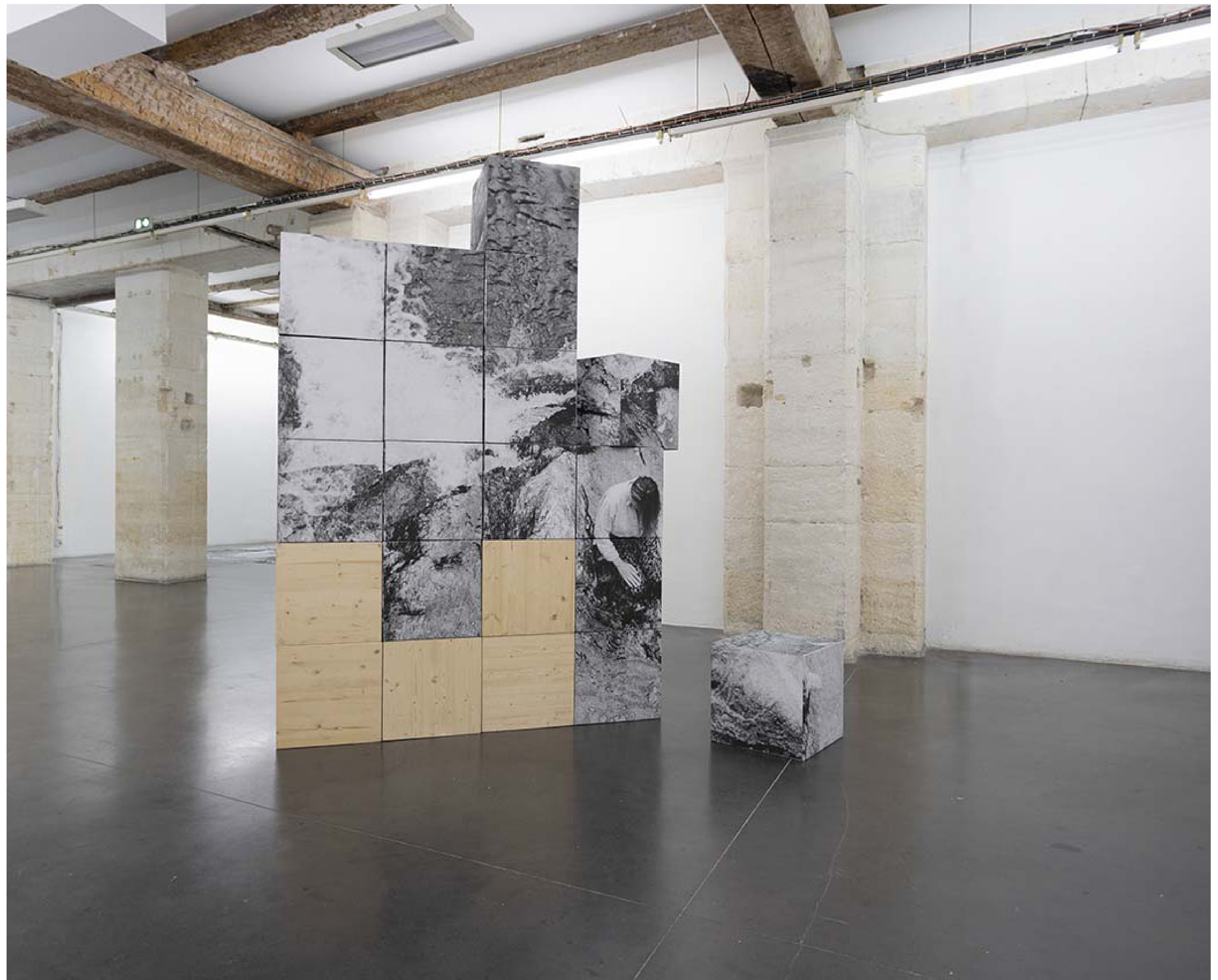
Image sans fin, installation, 2024 vue d'exposition «Les Roches Fluides», la compagnie lieu de création, Marseille, 2024