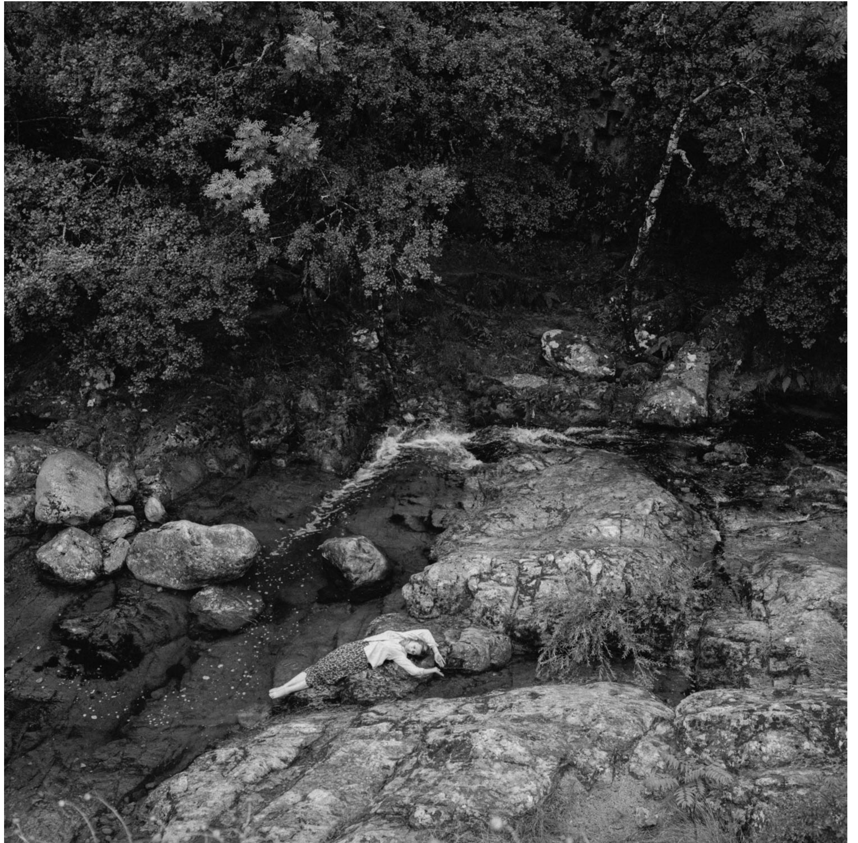
Mimésis (Autoportrait), 2024