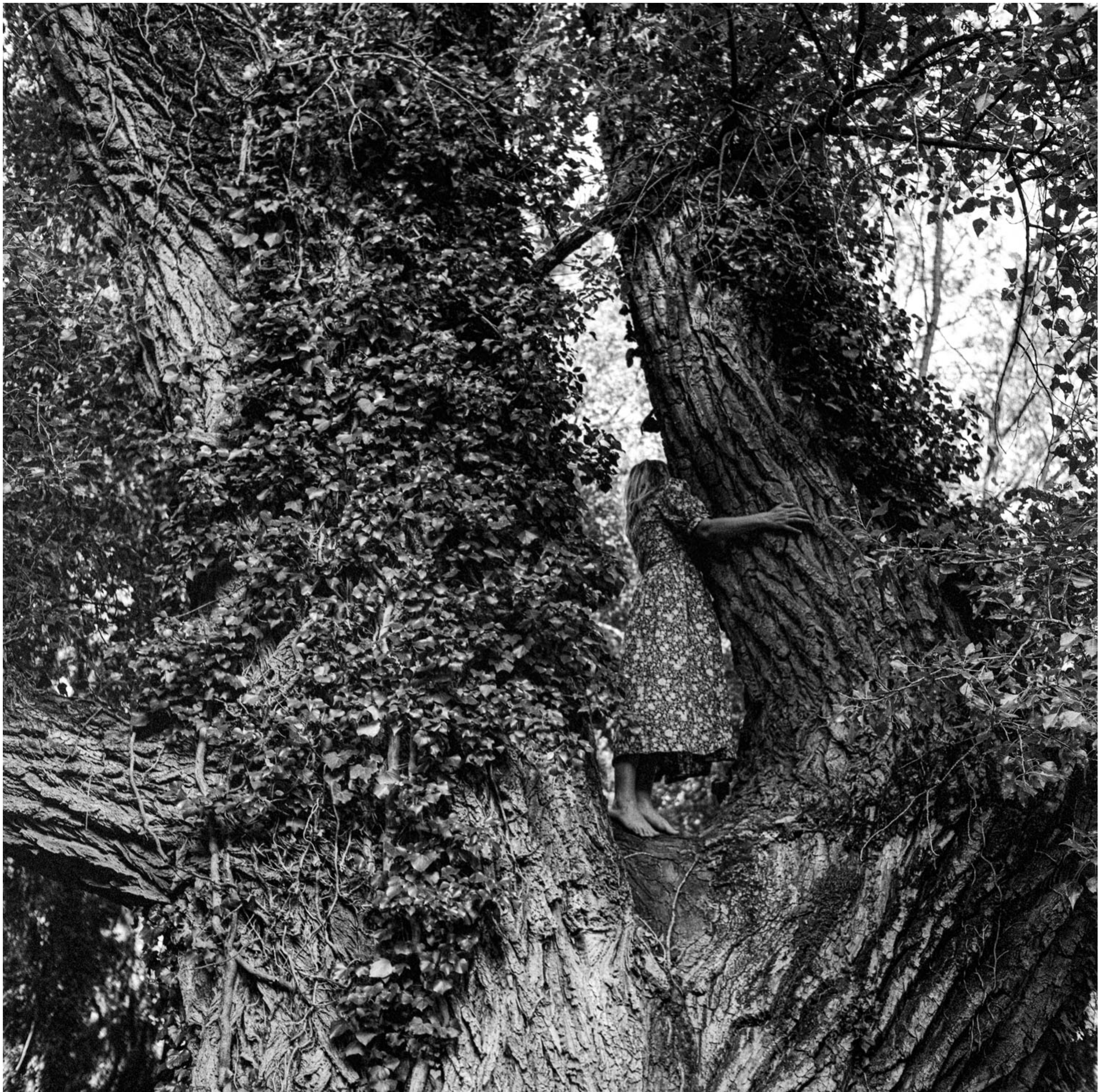
Mimésis (Autoportrait dans l'arbre), 2024