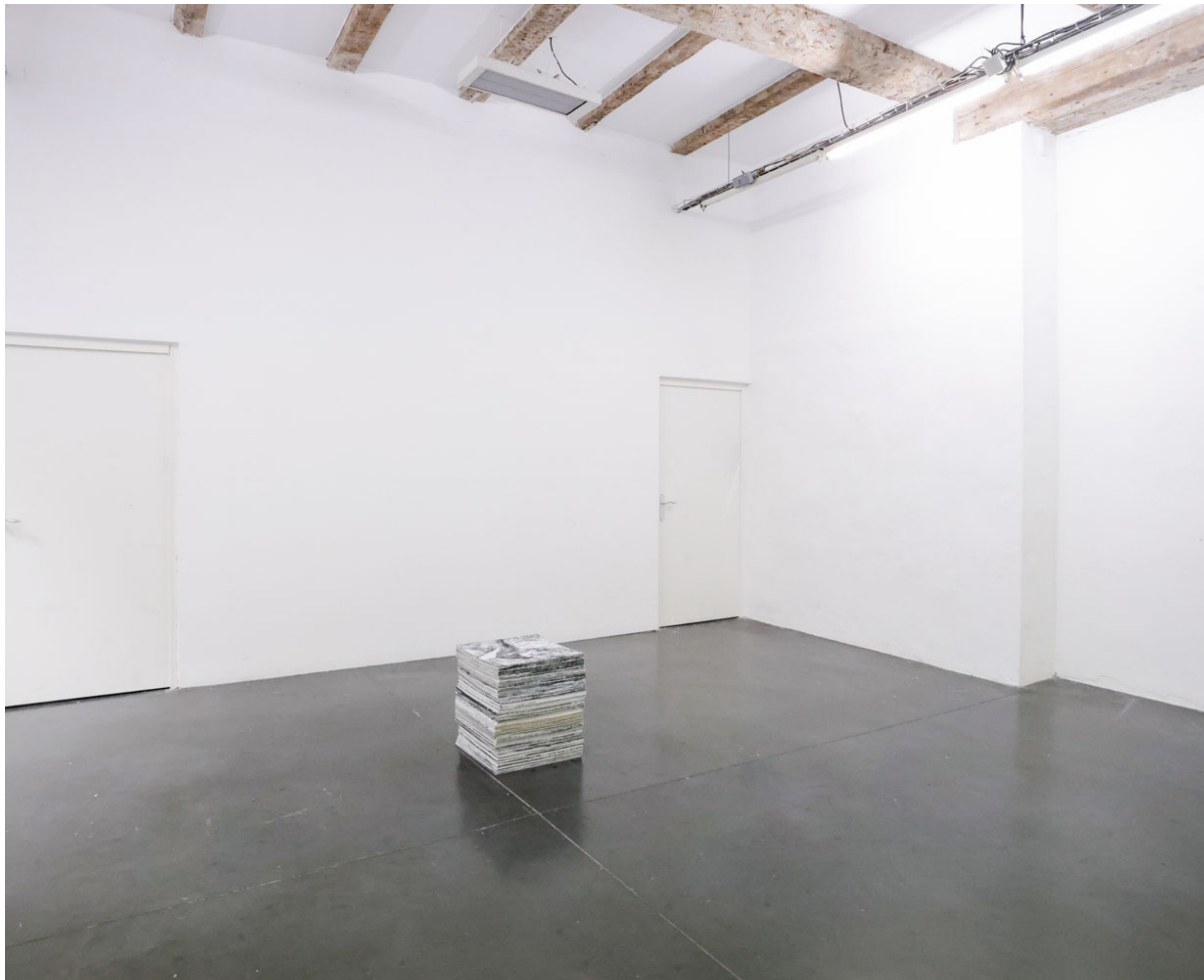
Corpus, installation, 2024 vue d'exposition «Les Roches Fluides», la compagnie lieu de création, Marseille, 2024