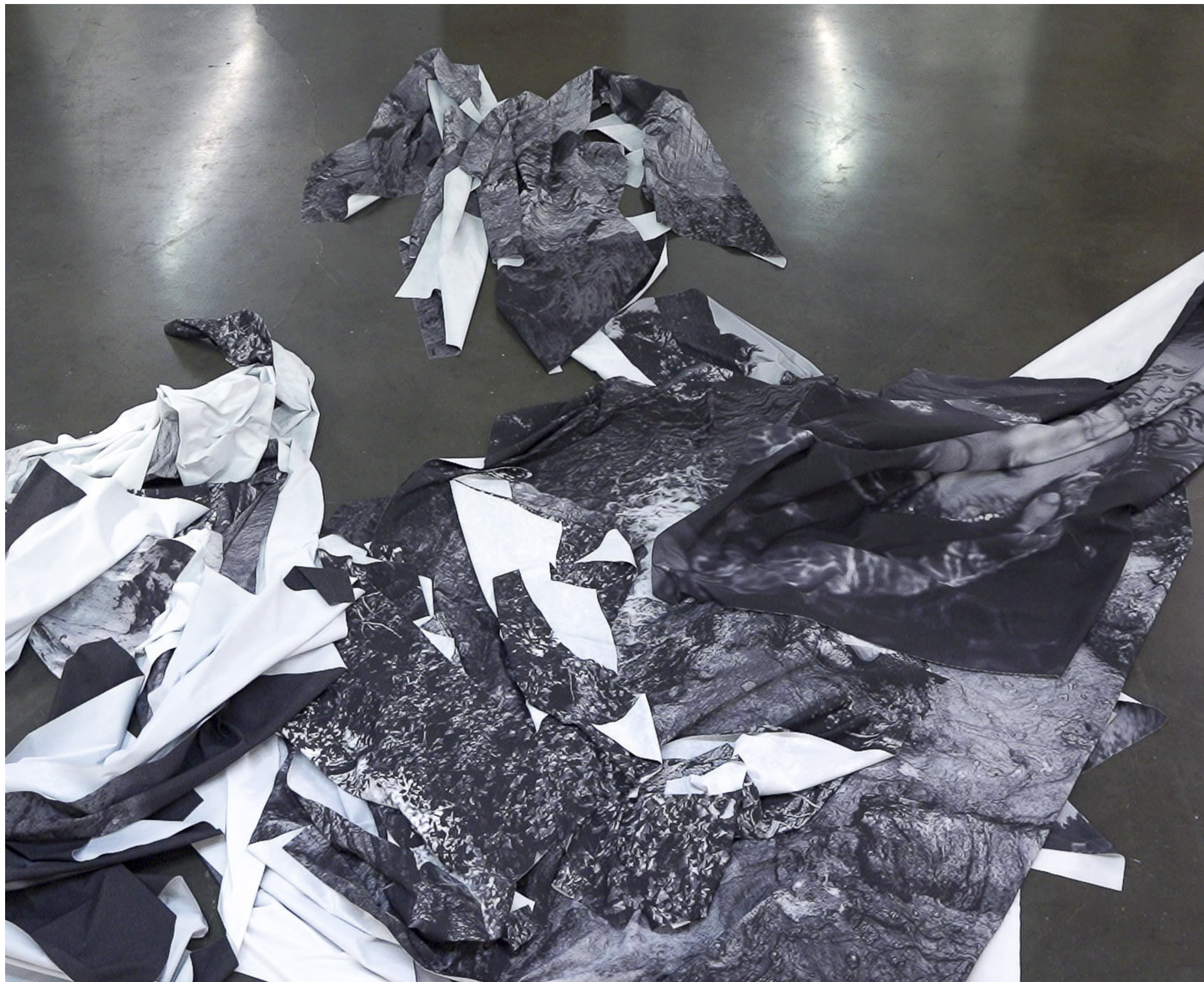
Robes, installation, 2024 vue d'exposition «Les Roches Fluides», la compagnie lieu de création, Marseille, 2024