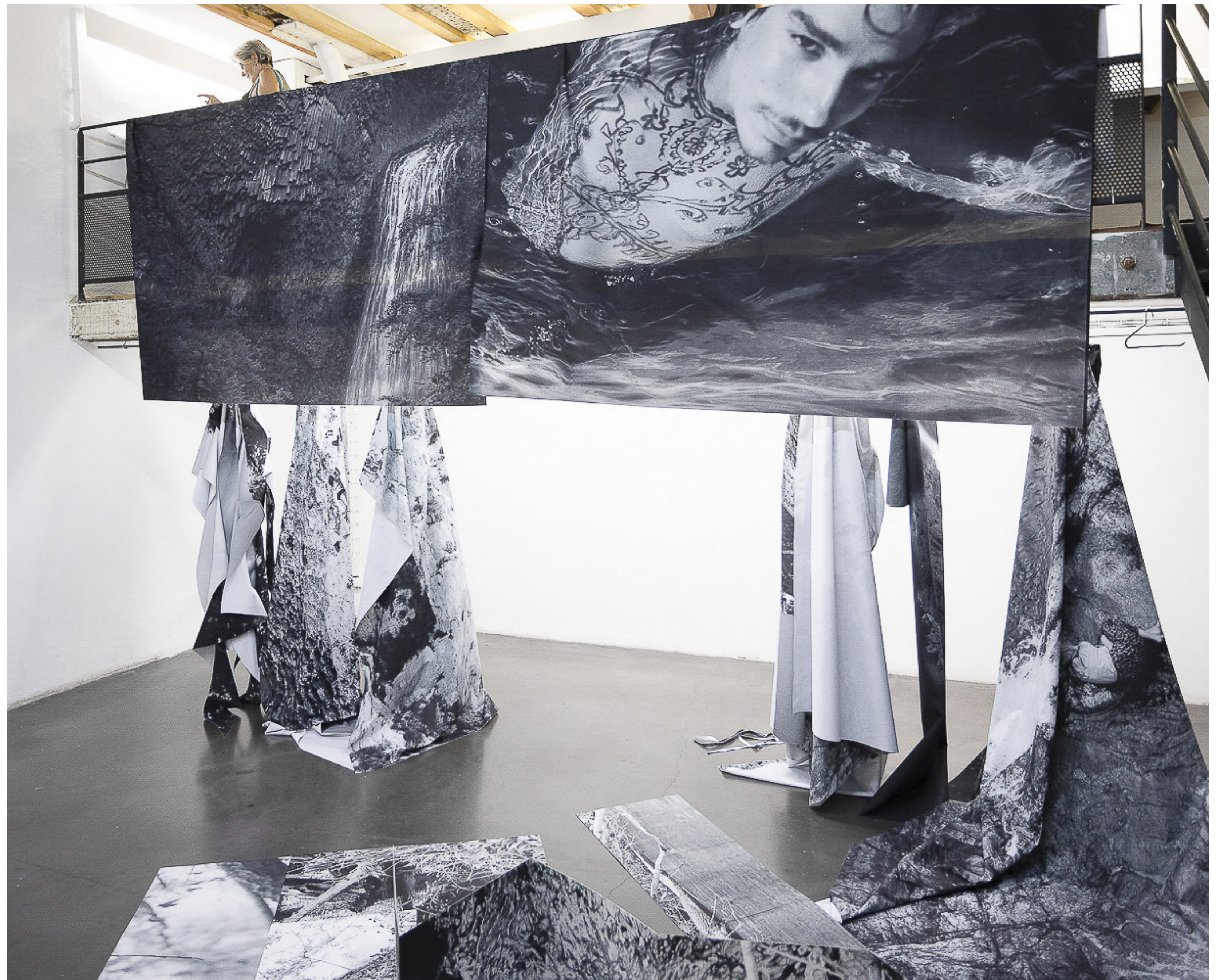
Robes, installation, 2024 vue d'exposition «Les Roches Fluides», la compagnie lieu de création, Marseille, 2024