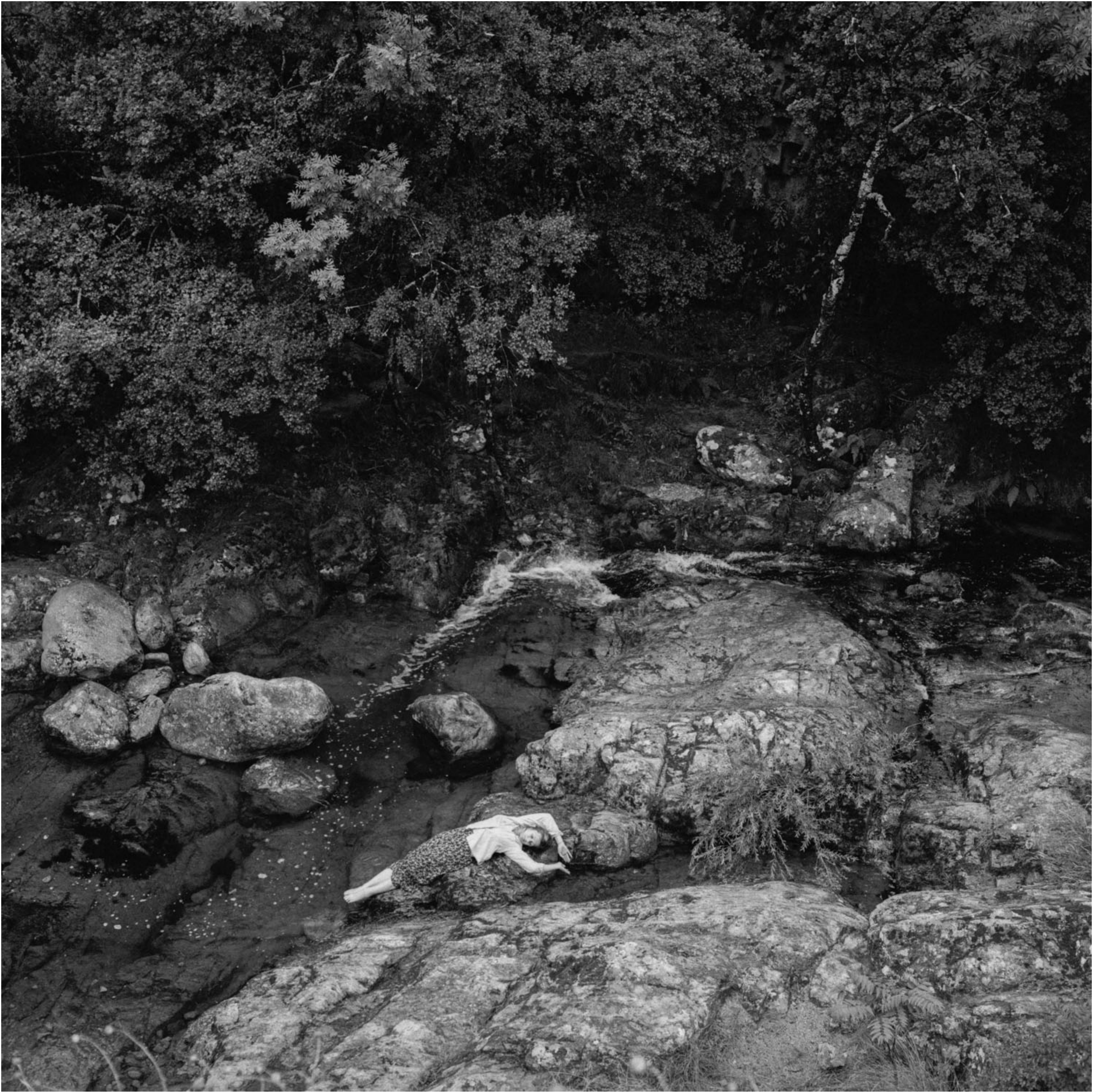
Mimésis (Autoportrait), 2024