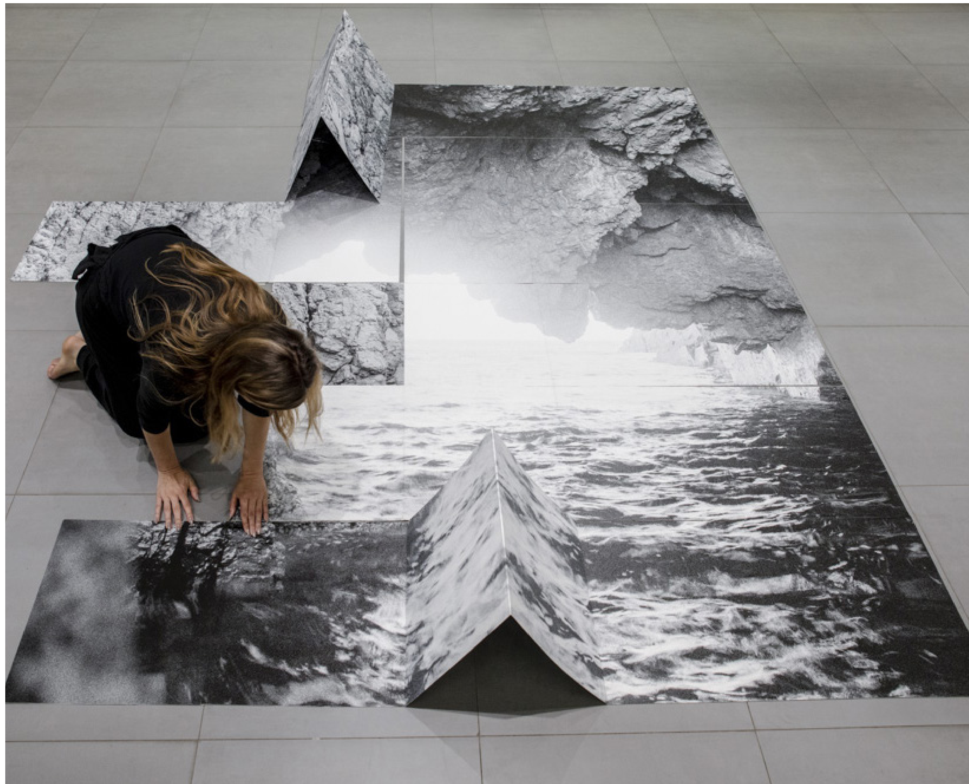
Palimpseste (Estérel), installation, 2022 vue d'exposition «Respirer l'Art», MIP Grasse, 2022