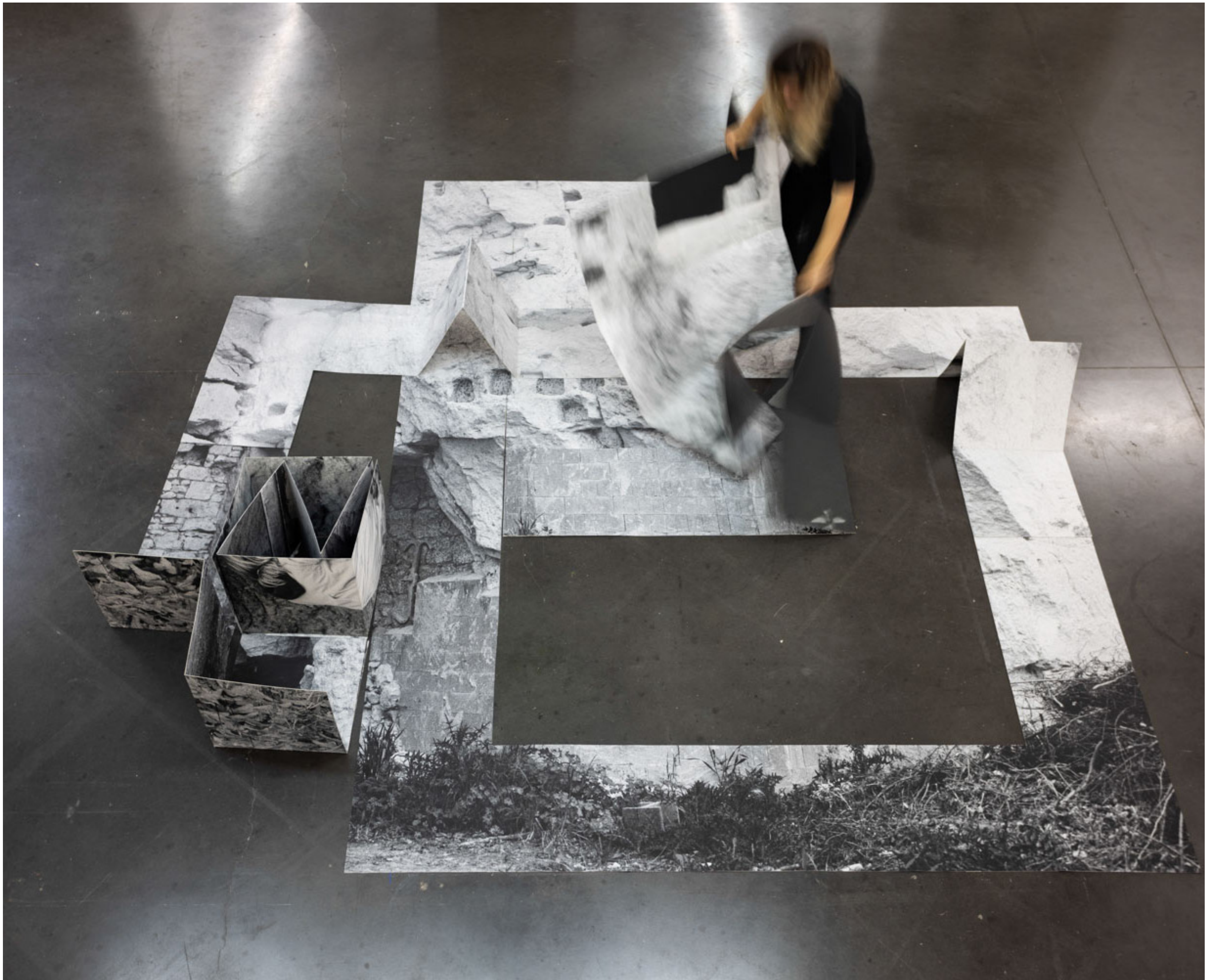
Roche (Tuffeau), installation, 2024 vue d'exposition «Les Roches Fluides», la compagnie lieu de création, Marseille, 2024