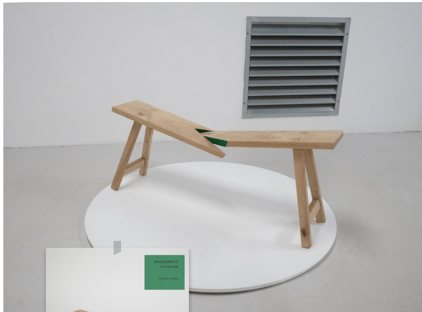
72e festival de Jeune création, 2022 miniature, Bien à vous, Fondation Pernod Ricard, 2022