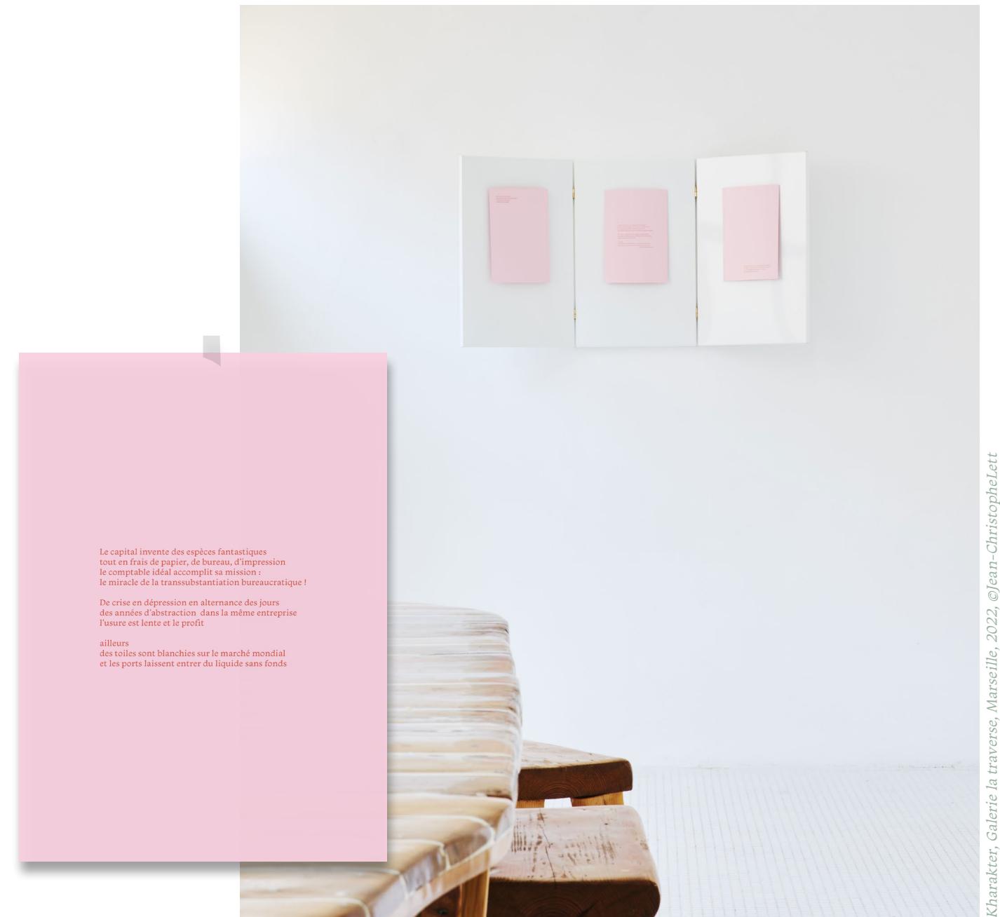
Kharakter, Galerie la traverse, Marseille, 2022

Sculpture d'un banc rompu en sapin qui revient sur l'étymologie du terme banqueroute . À l'origine, banqueroute vient de l'italien banca rotta qui signifie « banc cassé », en référence aux banquiers installés sur des comptoirs qui devaient rompre leur banc en public lorsqu'ils faisaient faillite. Ce geste symbolique leur interdisait donc d'exercer leur métier. Il introduit par ailleurs la question des dispositifs de lecture et pose ainsi celle de ma propre valeur : combien de textes les visiteurs sont-ils prêts à lire sans le confort d'un siège ?