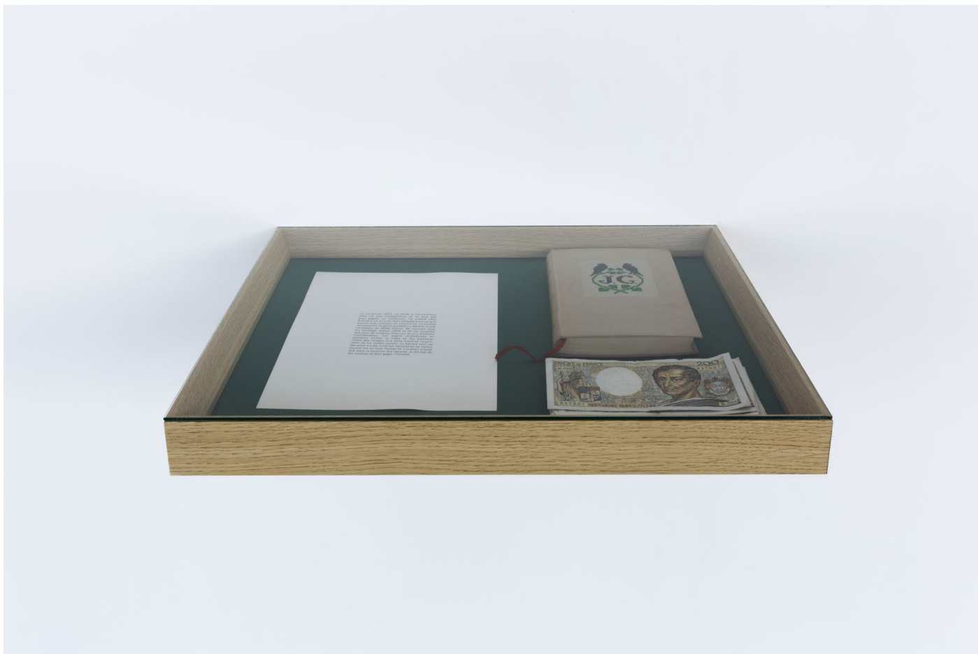
Vue de diplôme, ENSP, Arles