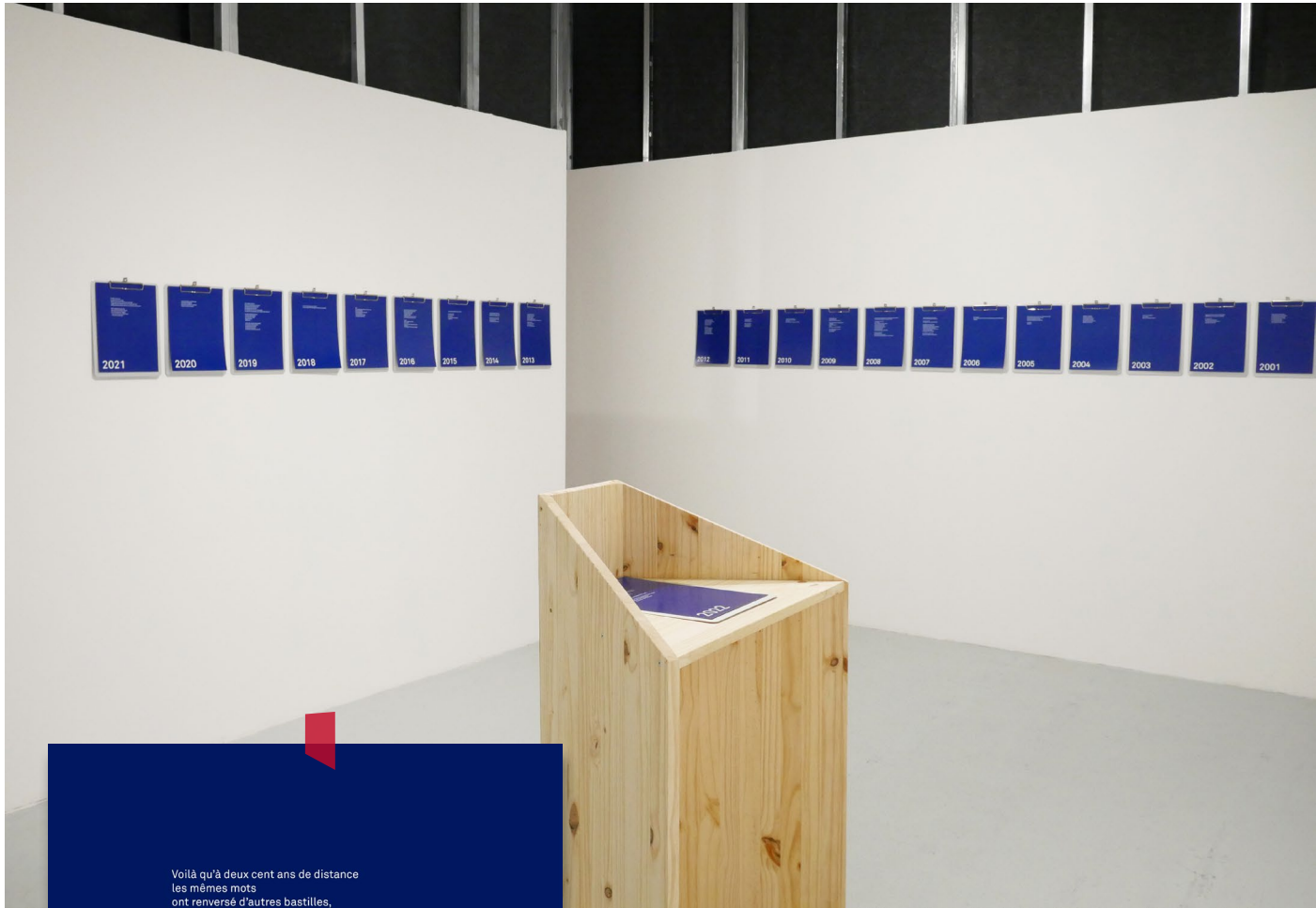
La Relève IV, Château de Servières, Festival parallèle, 2022.