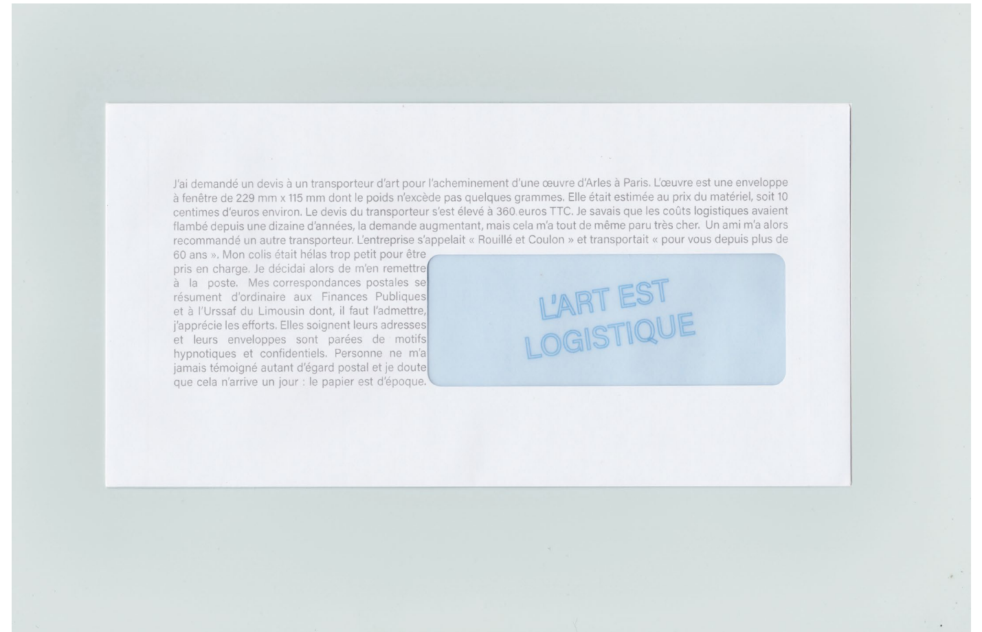
Janelas, MAMC, Saint-Etienne, 2022