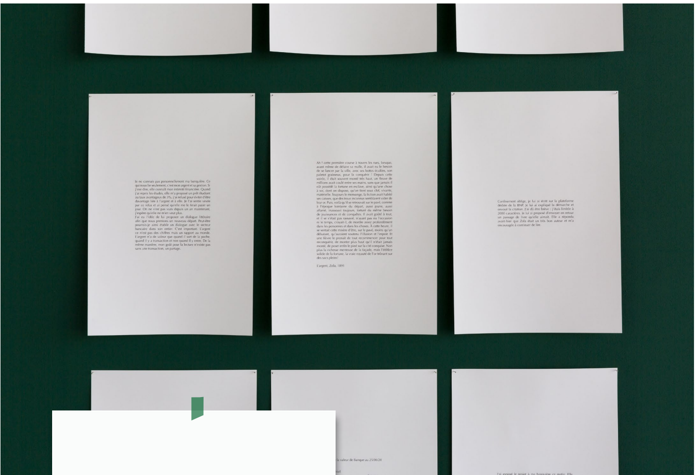
Career girls, Mécènes du sud, Montpellier, 2022

Installation composée de soixante-deux poèmes et d'un pupitre «Jupiter». Chaque poème est écrit par caviardage à partir des discours de vœux présidentiels depuis 1960, lorsque de Gaulle a ritualisé ce rendez-vous. La performativité et l'oralité qui constituent le cœur de l'efficacité de la parole politique sont effacées au profit de la matérialité seule de l'écriture poétique politique que chacun est libre de s'approprier. Soixante-et-un poèmes sont affichés en linéaire au mur et le dernier (2022) est présenté sur un pupitre en sapin dont la forme reprend celle du pupitre «jupiter», dessiné pour Mitterrand et que Macron a été le premier président à réutiliser.