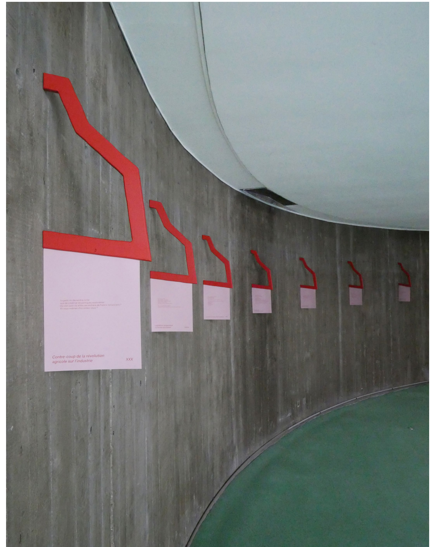
La langue des oiseaux, Jeune création, Espace Niemeyer, siège du PCF, 2022