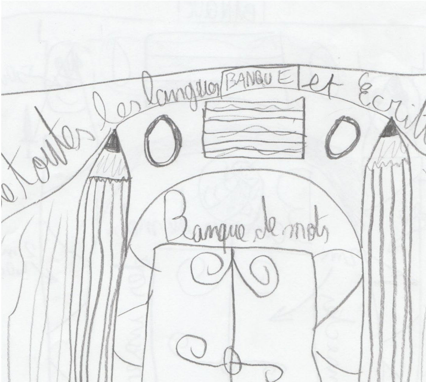
Dessin préparatoire de Ferdinand et Elio

Signiau, DOC, Paris ©bojetspointus ' (à droite, Caroline Reveillaud)