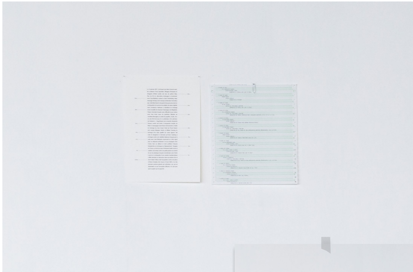
35 Fanton(s), L'Opera, Arles, 2021.