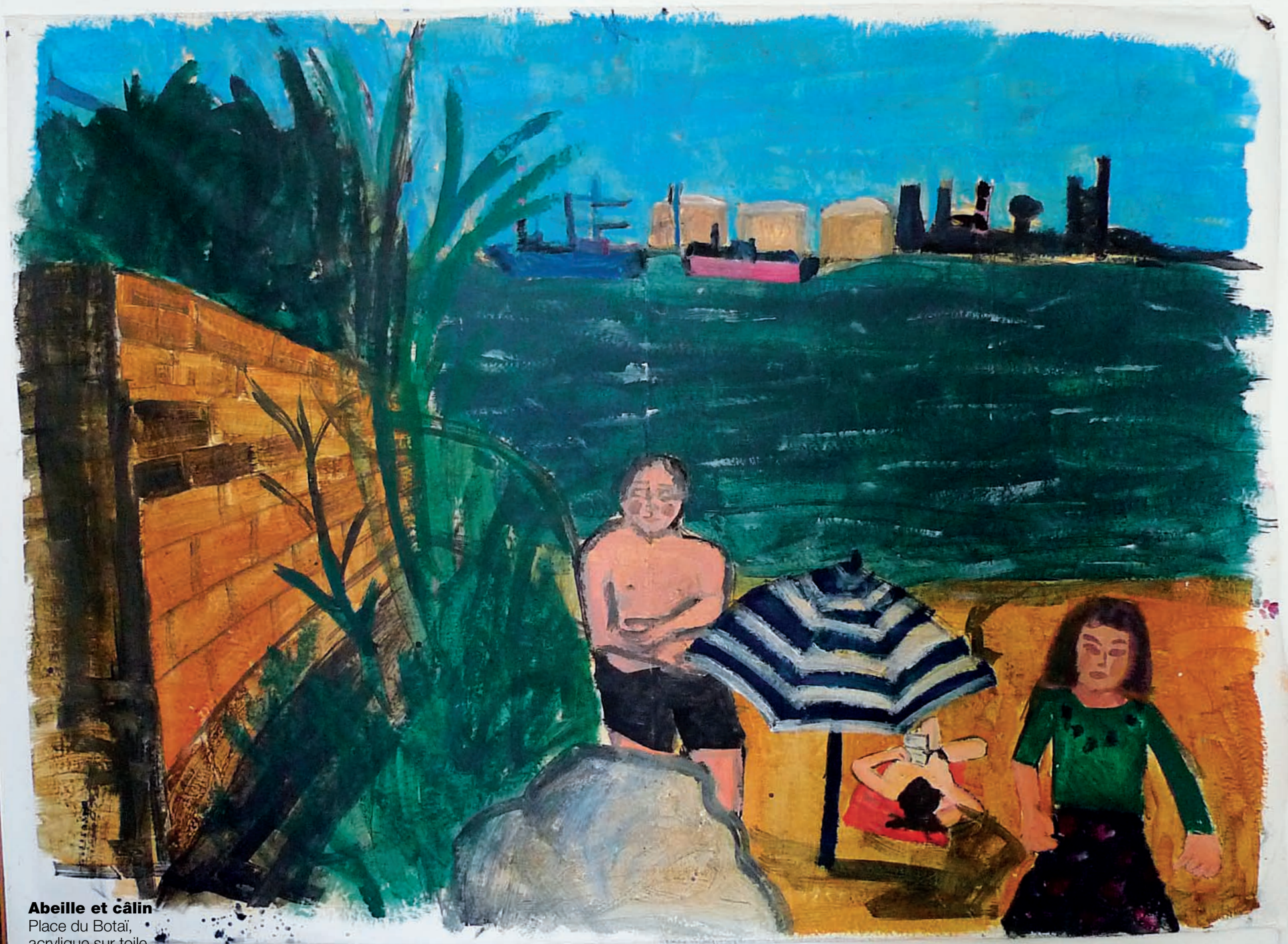
Abeille et câlin Place du Botai, acrylique sur toile, 214 x 290 cm, 2015