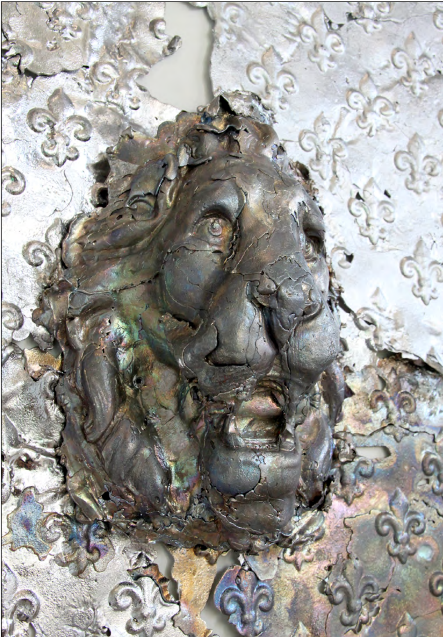
Gaindé plomb 27x19cm 2018