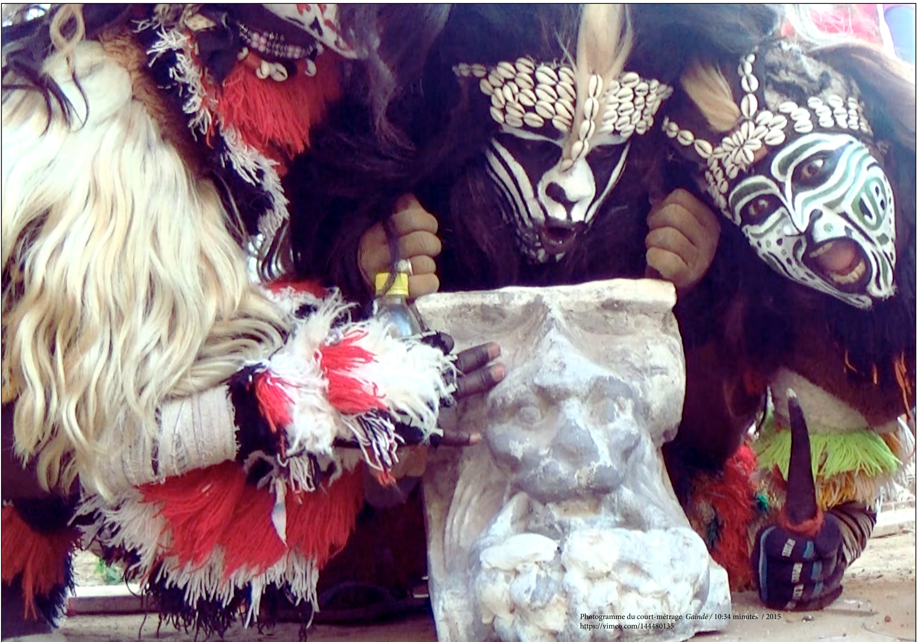
Photogramme du court-métrage Gaindé / 10:34 minutes / 2015 https://vimeo.com/144480135