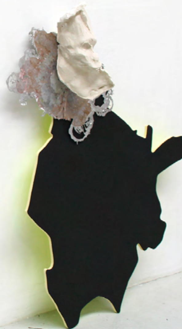
Monkey*Poppy Zinc / Étain / Cuivre / Plâtre / Bois 132x98cm 2017