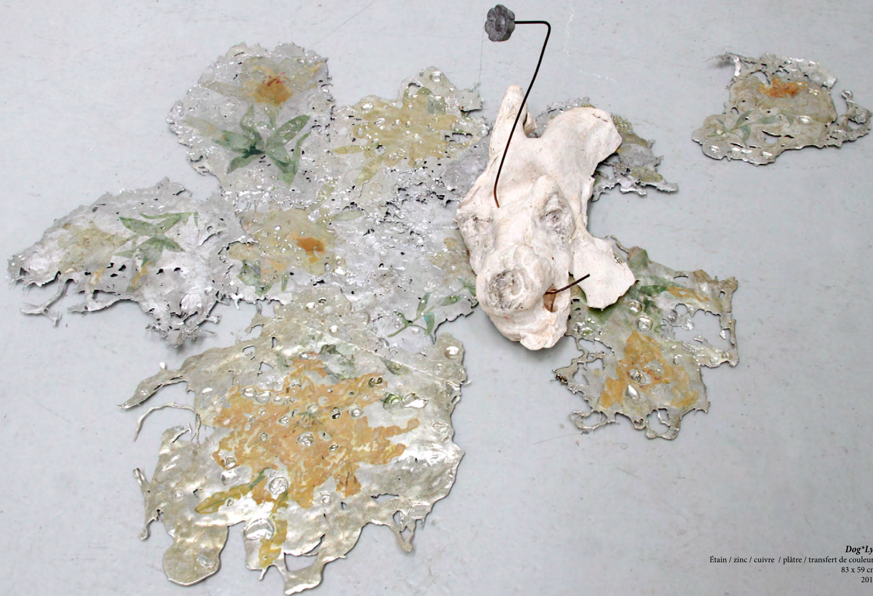
Dog*Lys Étain / zinc / cuivre / plâtre / transfert de couleurs 83 x 59 cm 2017