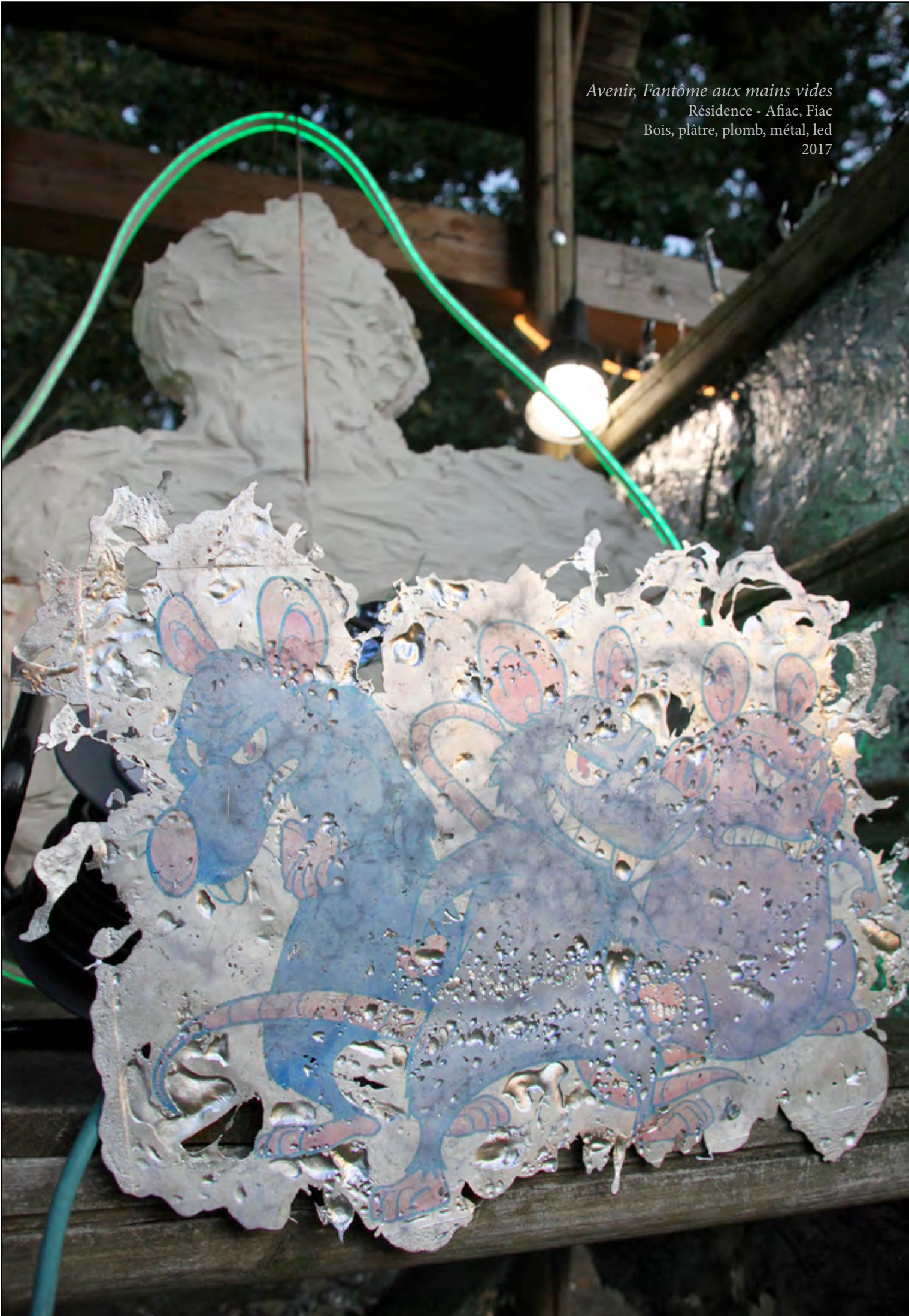
Avenir, Fantôme aux mains vides Résidence - Afiac, Fiac Bois, plâtre, plomb, métal, led 2017