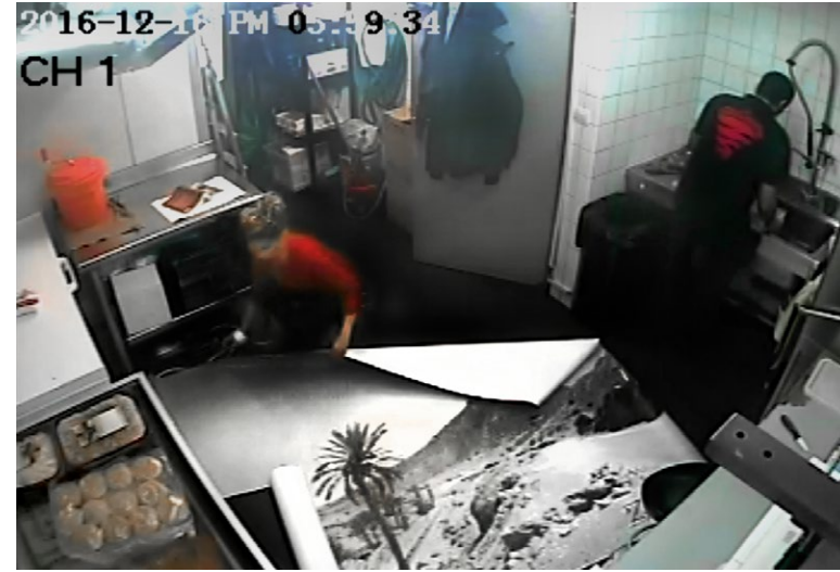
Salade tomates oignons, 2016 exposition «Supervues», Hôtel Burrhus, Vaison-la-Romaine Intervention dans un kebab diffusée en direct dans l'espace d'exposition grâce au système de vidéosurveillance du restaurant.