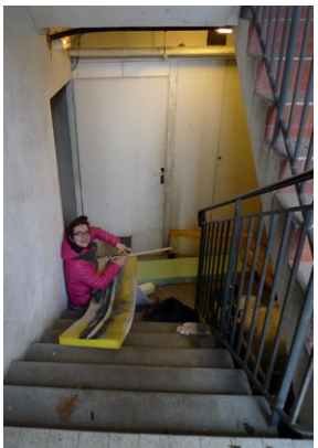
ci-contre : images extraites d'un diaporama projeté durant la performance