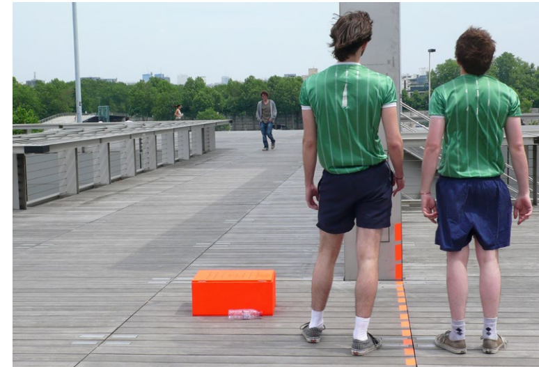
Perdues d'avance, 2010, Bibliothèque Nationale de France, Paris Je coach 11 figu- rants pour trouver 'l'idée avec un grand I', celle que je n'ai pas trouvée. Training pour un échec prémédité.