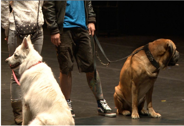
Les maîtres performance, 2013 concours Danse Elargie, Théâtre de la Ville, Paris (projet finaliste) 25 maîtres et 26 chiens sur le plateau du Théâtre de la Ville: mise en scène d'une réalité aléatoire, à la fois à la fois parfaitement animale et étrangement humaine.