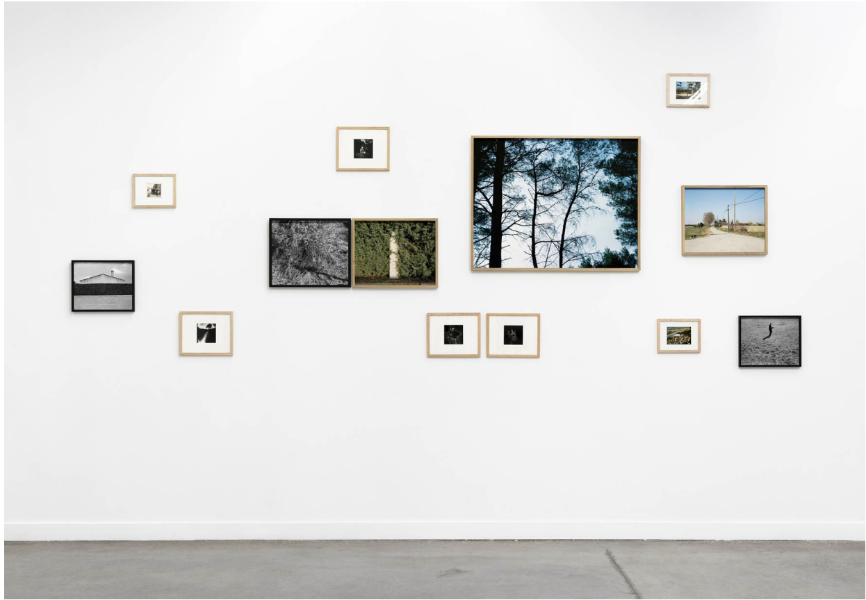
Exposition Le temps présent, FRAC Marseille, 2017.