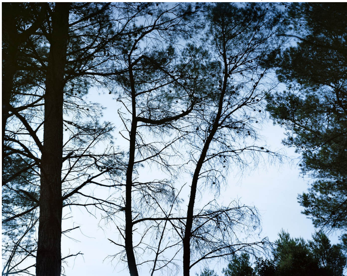
Eygalières, 2014. 80x100 jet d'encre sur dibond cadre chêne. Collection FRAC