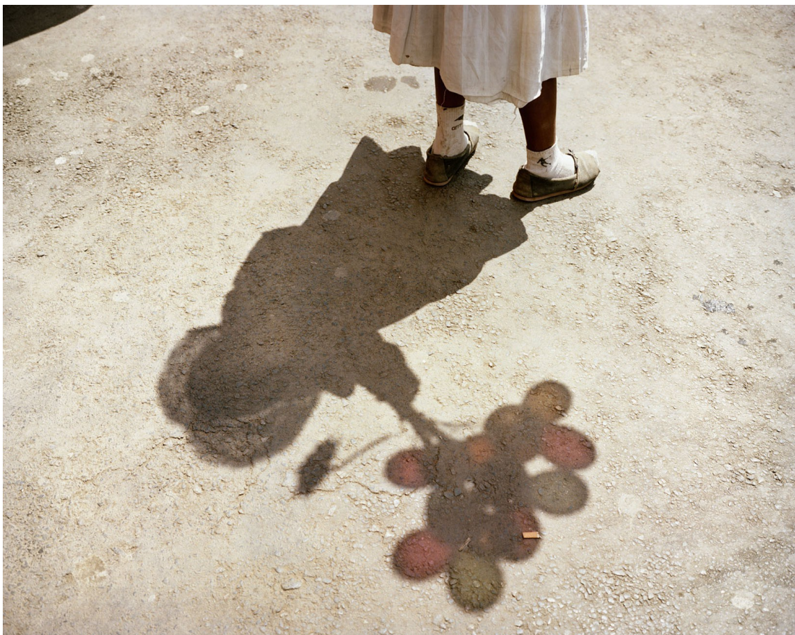
Tirage pigmentaire 80x100. 2017