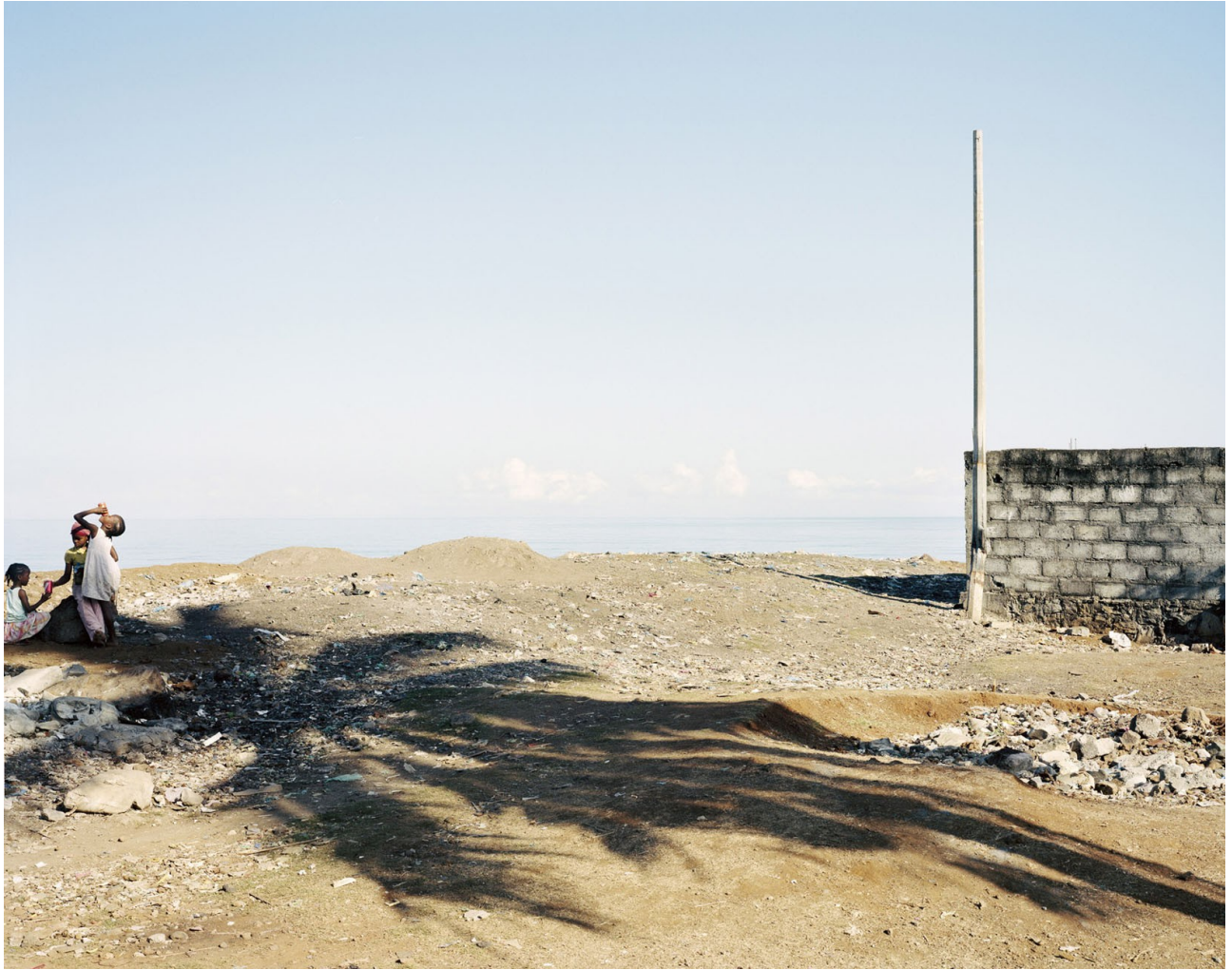
Ouani, Comores 2016. 80x100 sur dibond