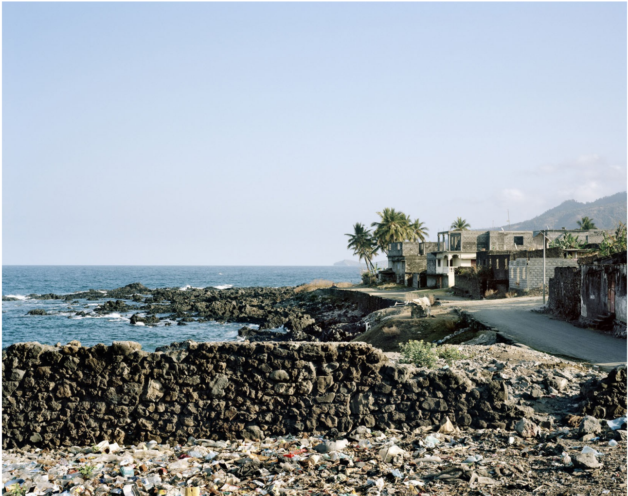
Domoni, Anjouan, Comores 2016 80x100 sur dibond.

J'ai travaillé au moyen-format et la chambre 4x5 inches, en couleur. Ce projet a été réalisé au cours de six séjours entre 2008 et septembre 2016.