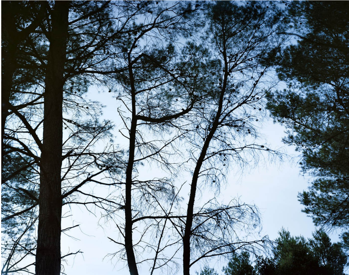
Eygalières, 2014. 80x100 jet d'encre sur dibond cadre chêne. Collection FRAC