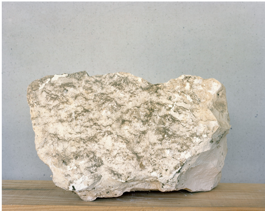
L'hortus, en cours , chambre 4 x 5 inches, Eygalières, 2021.