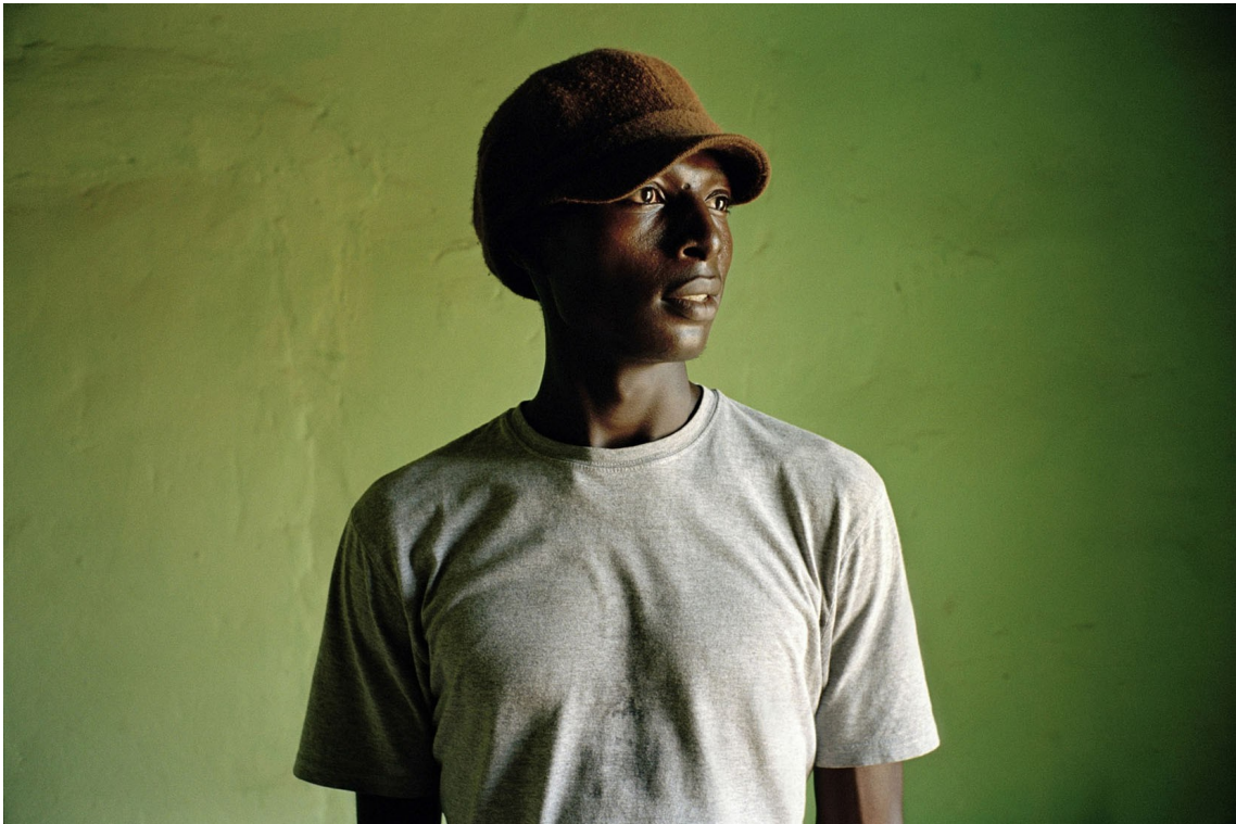
Tirage argentique 50x70. 2008