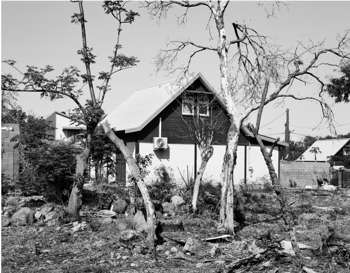
Rivière des Galets, 2021.

Assistant pendant trois années au sein du collectif de photographe BKL (1990/1995), j'ai développé des centaines de film et tirer tout autant de photographies issues d'un projet au long cours sur la requalification de trois quartiers défavorisés à la Réunion, sans jamais y aller. Trente ans plus tard, munis de visuels, je retrouve ou non, ces lieux, les arpente, et confronte ainsi ma formation à ma pratique.