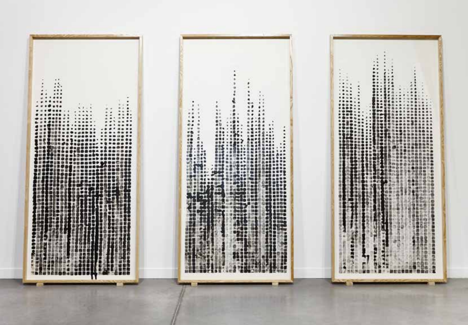
Black Ice Cube Drawings, 2014 Encre de chine sur papier, 3x (120 x 250) cm