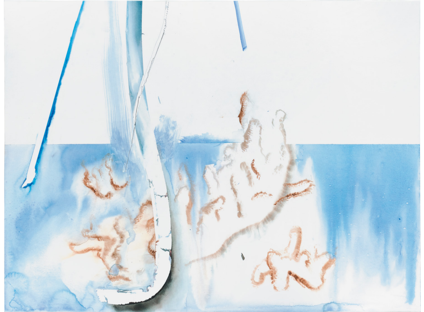
Cheval-de-frise 2018 Pierre noire et aquarelle sur papier 60 x 80 cm