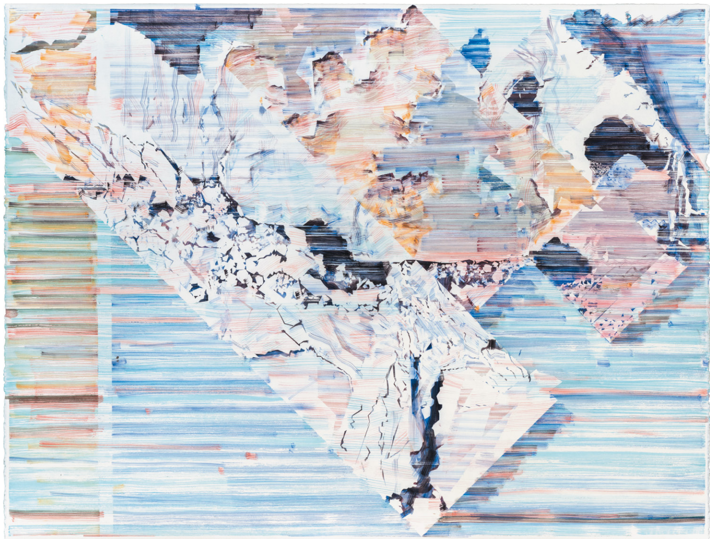
François-Joseph (Îles) 2018 Aquarelle sur papier 100 x 131 cm