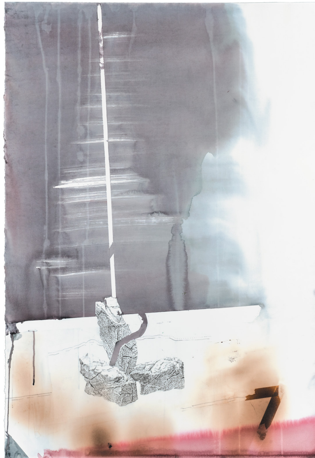
Cheval-de-frise 2018 Pierre noire et aquarelle sur papier 112 x 77,5 cm