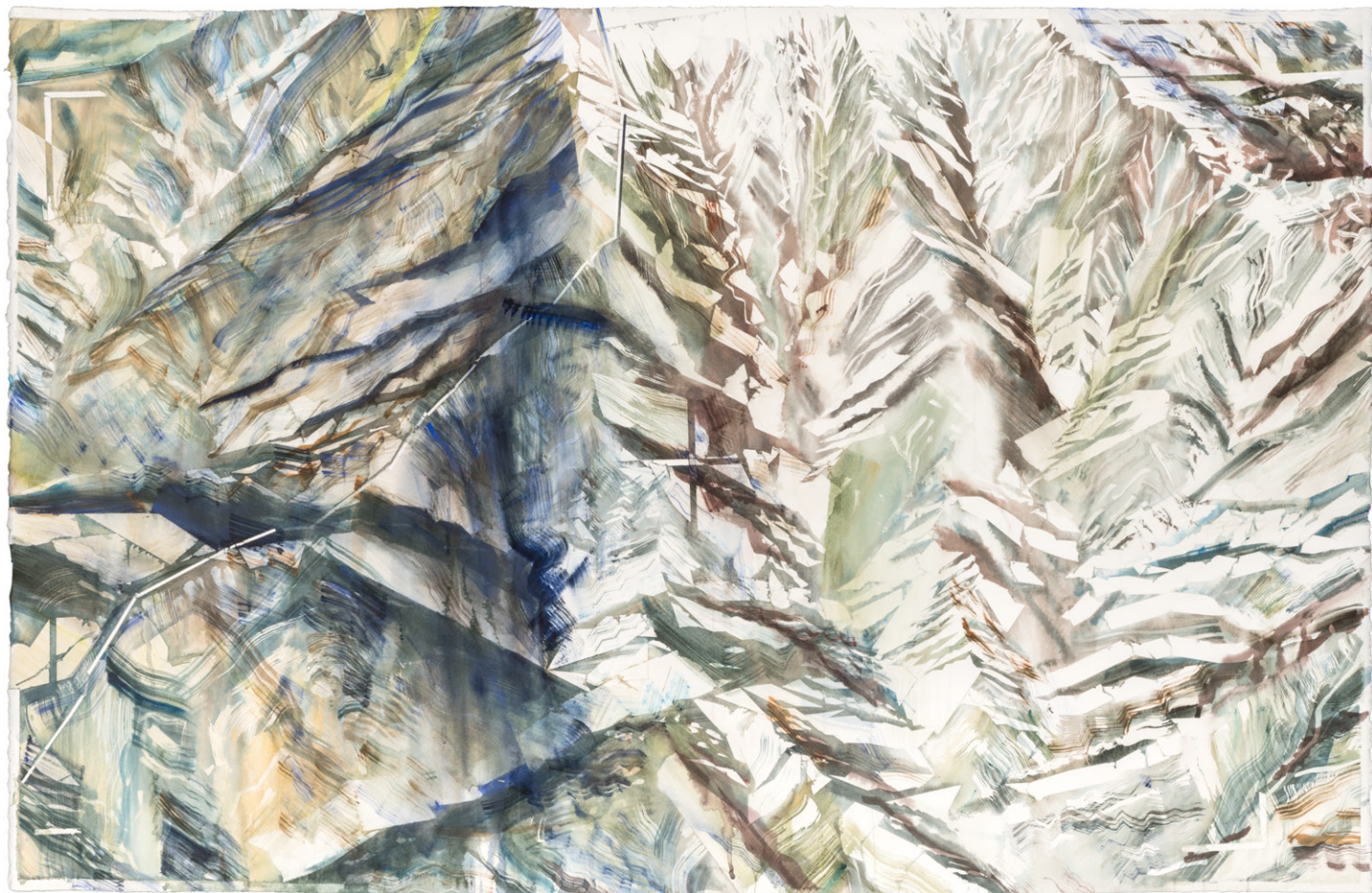
Google Earth Paropamisos 2018 Aquarelle sur papier 85 x 131 cm