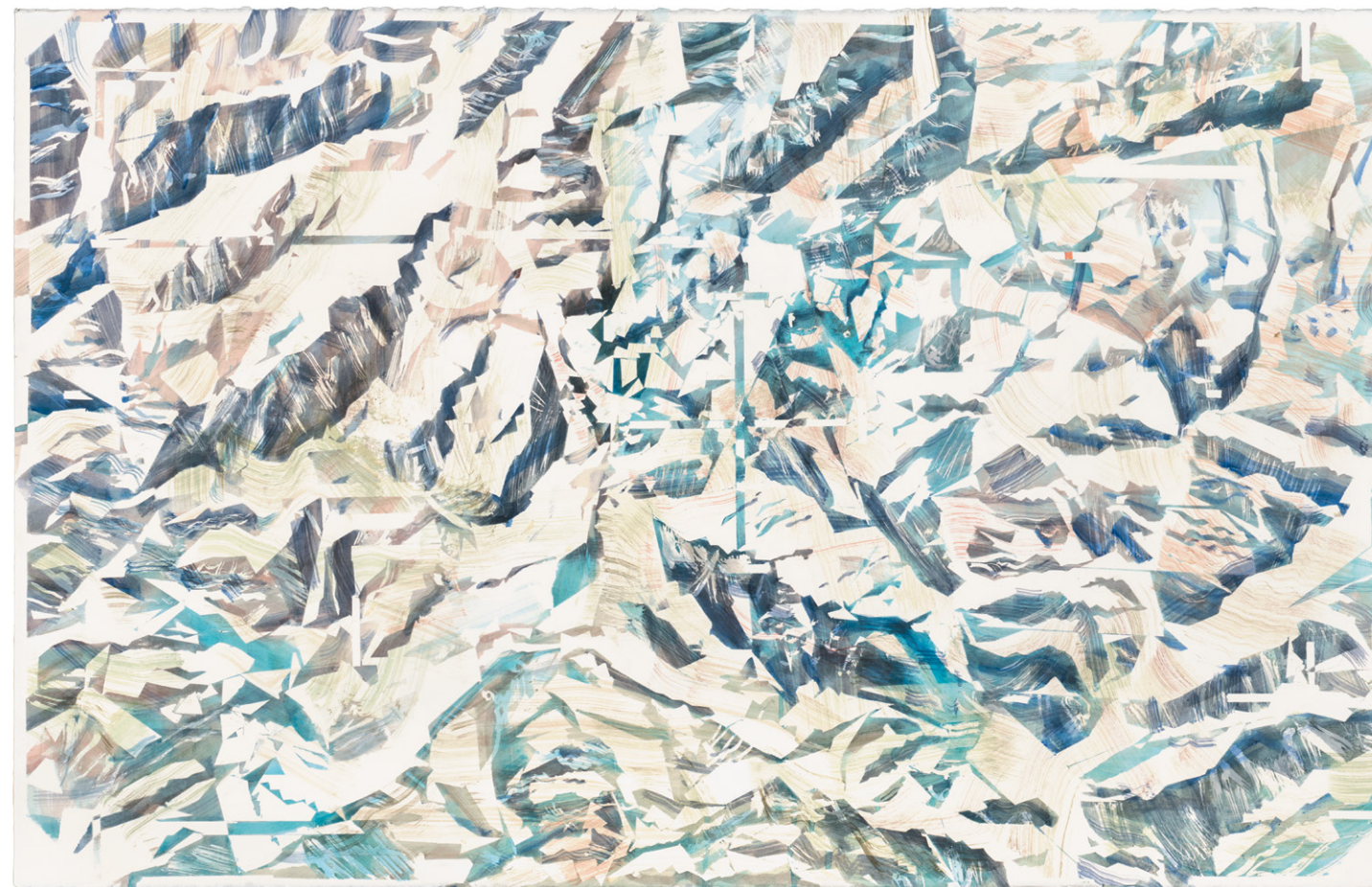
Hannibal disparu (Google Earth Hannibal), 2017