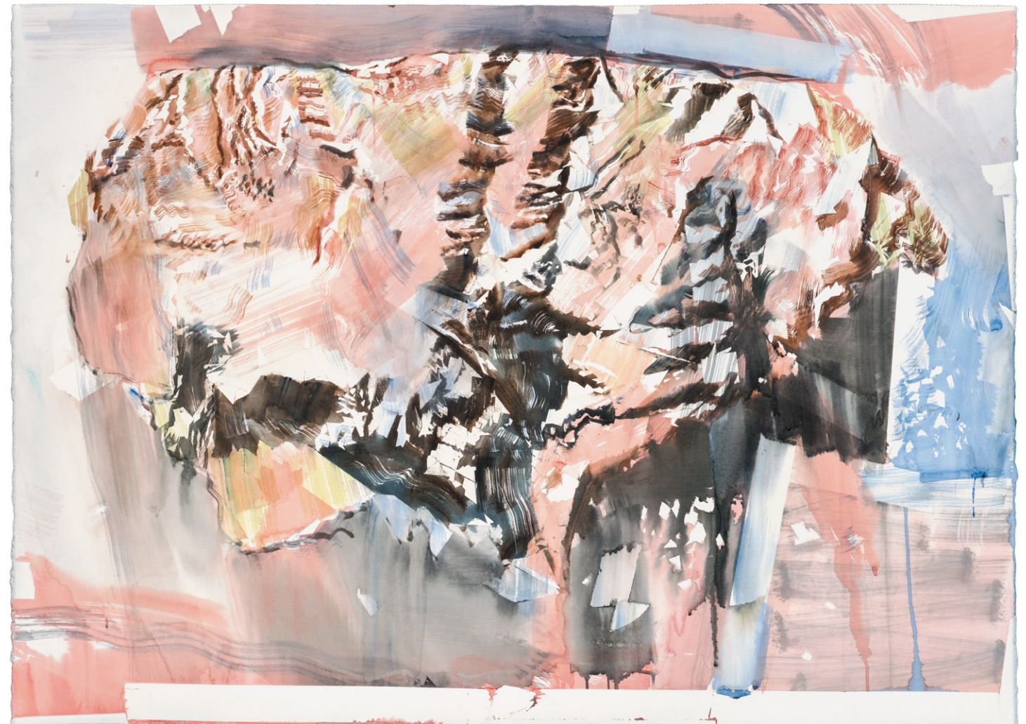
Alexander Selkirk (Îles) 2018 Aquarelle sur papier 94 x 131 cm