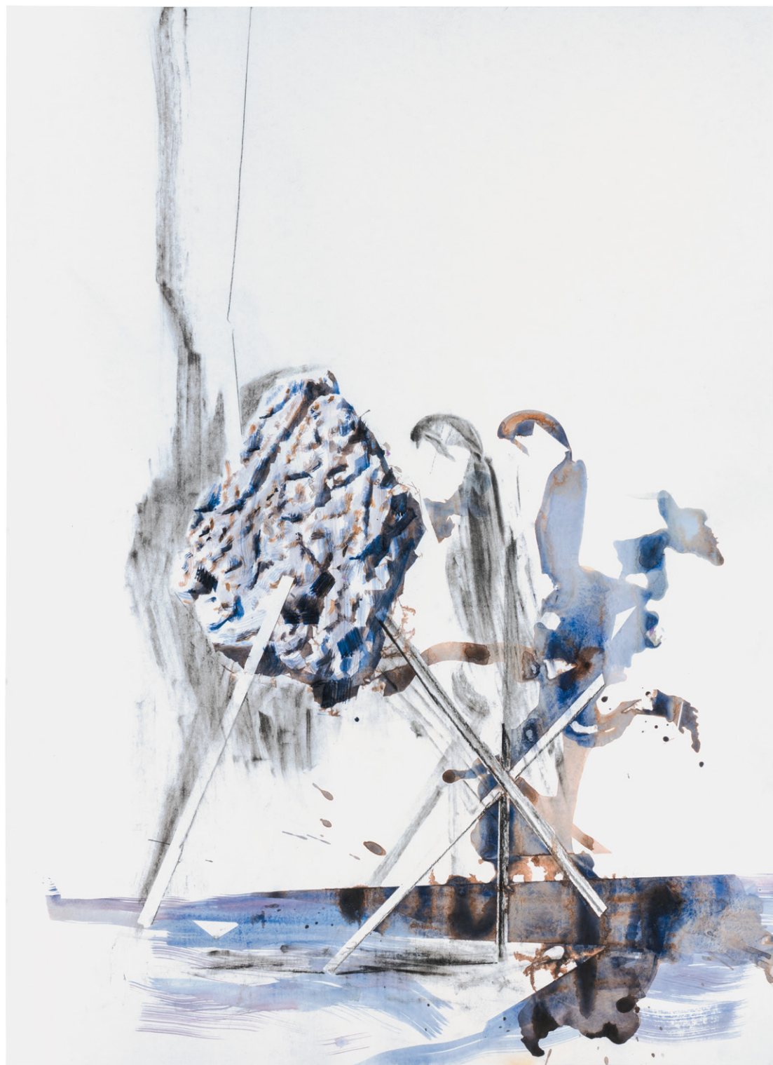
Cheval-de-frise 2018 Pierre noire et aquarelle sur papier 105 x 75 cm