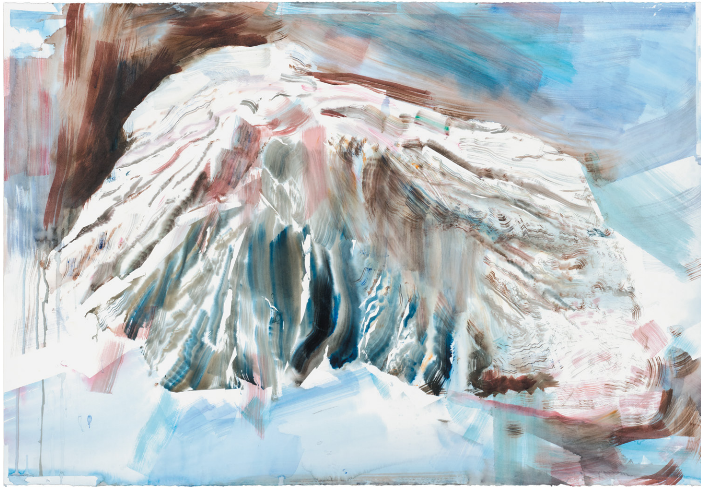
Stromboli (Îles) 2018 Aquarelle sur papier 77,5 x 112 cm