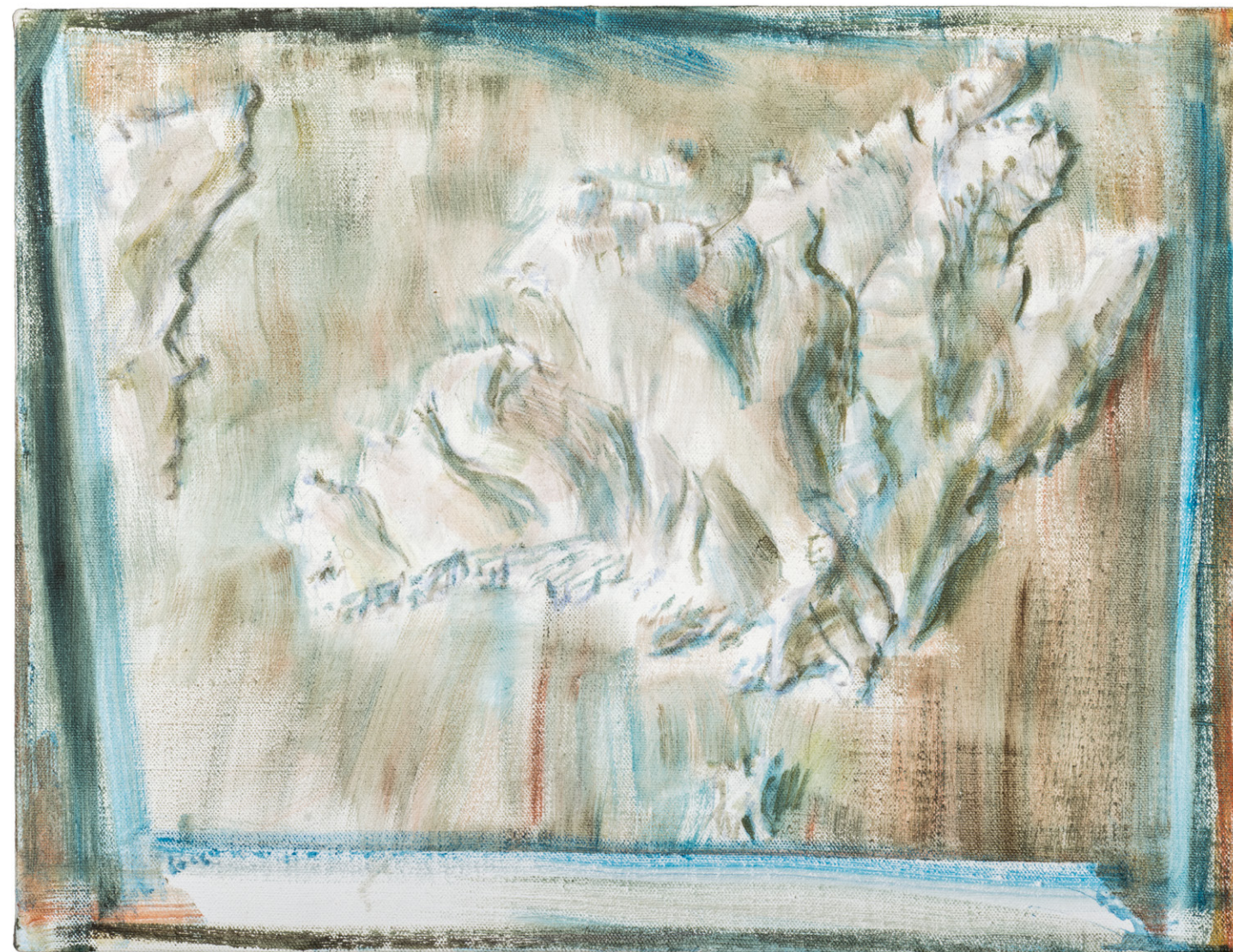
L'île de Port-Cros (Plans-reliefs) 2016 Huile sur toile 50 x 65 cm