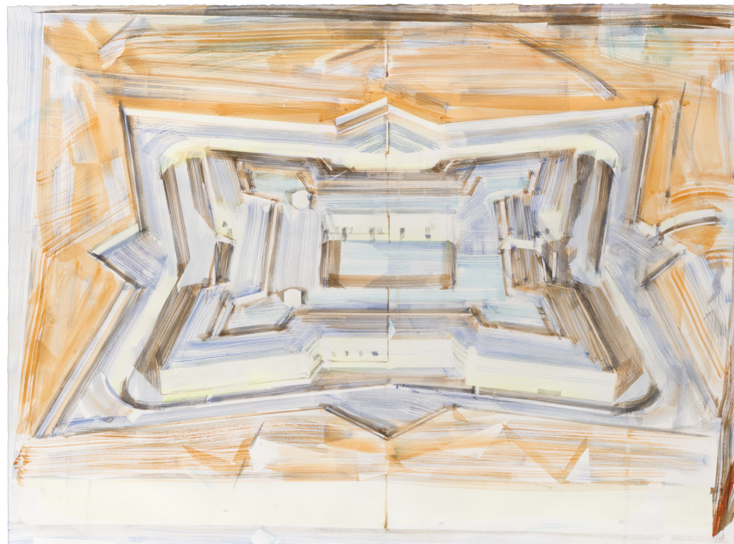
Redoute Vauban (Modèle Théorique) 2018 Aquarelle sur papier 56 x 75 cm