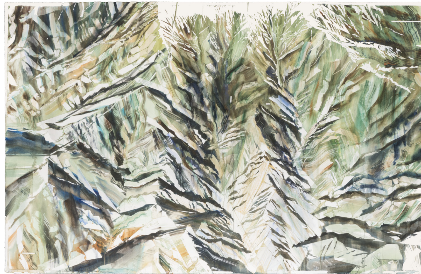
Google Earth Paropamisos 2018 Aquarelle sur papier 90 x 141 cm