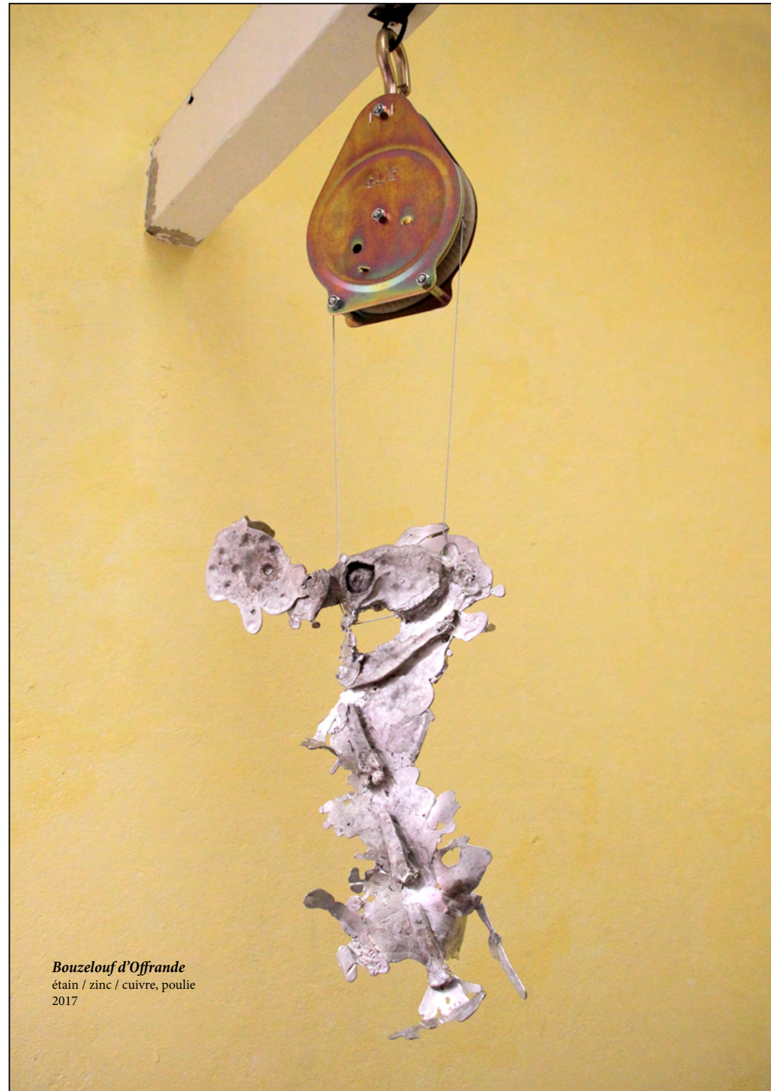
Bouzelouf d'Offrande étain / zinc / cuivre, poulie 2017