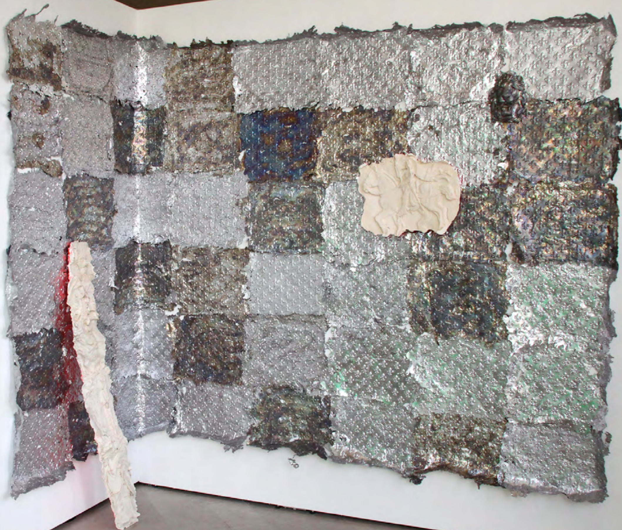
Amen ôôôôôôôô Béni plomb, plâtre, led 63 e Salon Montrouge 2018