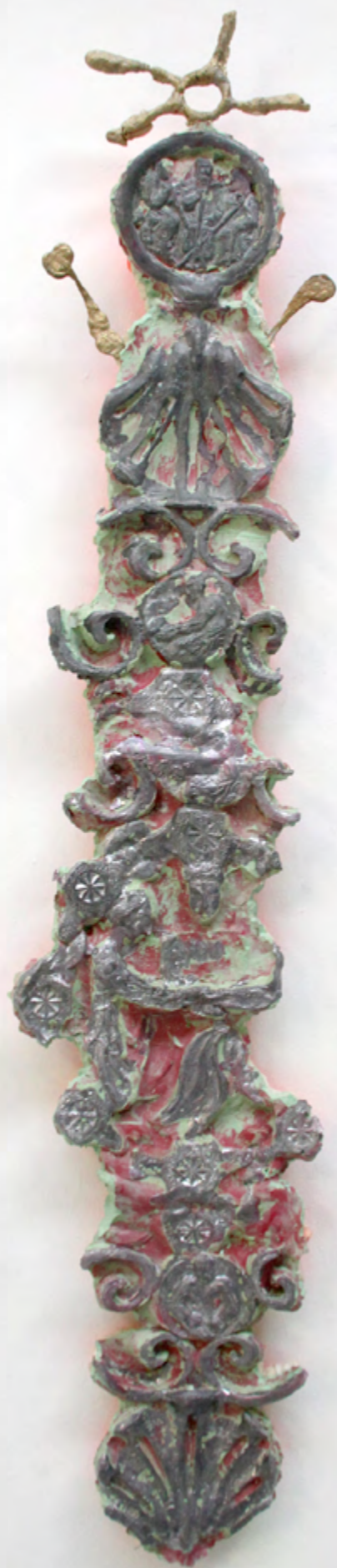
Ceux de L'Avenir plomb, plâtre 165x17 cm 2018