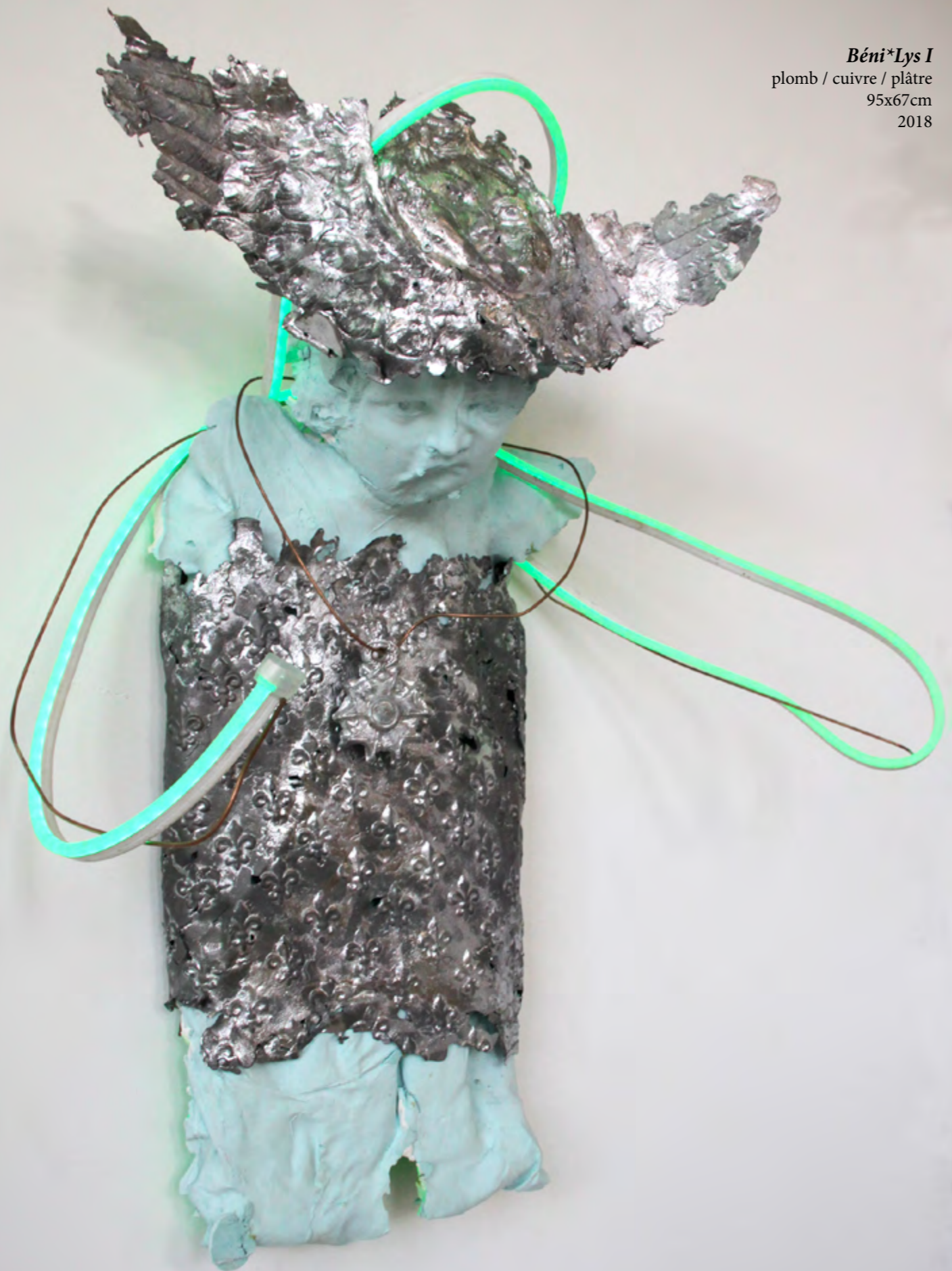
Béni*Lys I plomb / cuivre / plâtre 95x67cm 2018