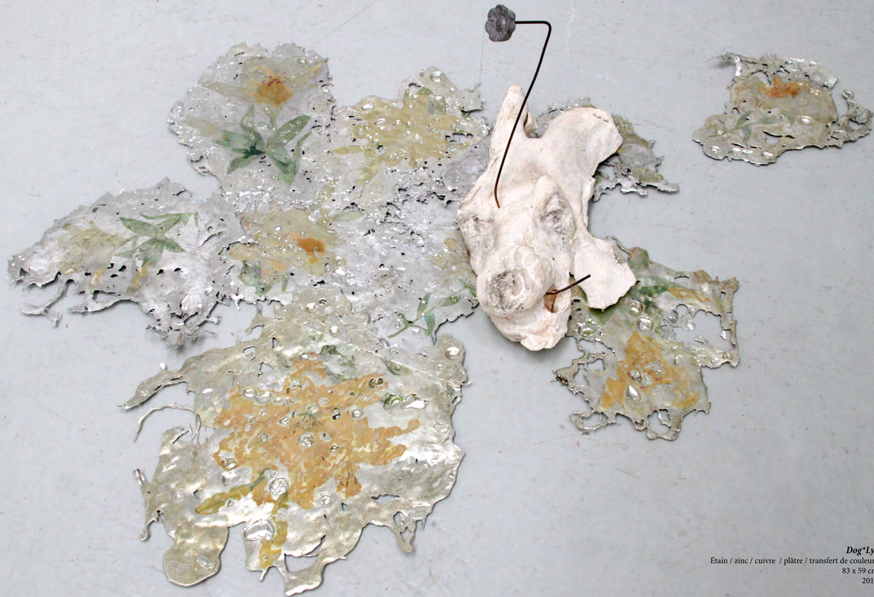
Dog*Lys Étain / zinc / cuivre / plâtre / transfert de couleurs 83 x 59 cm 2017