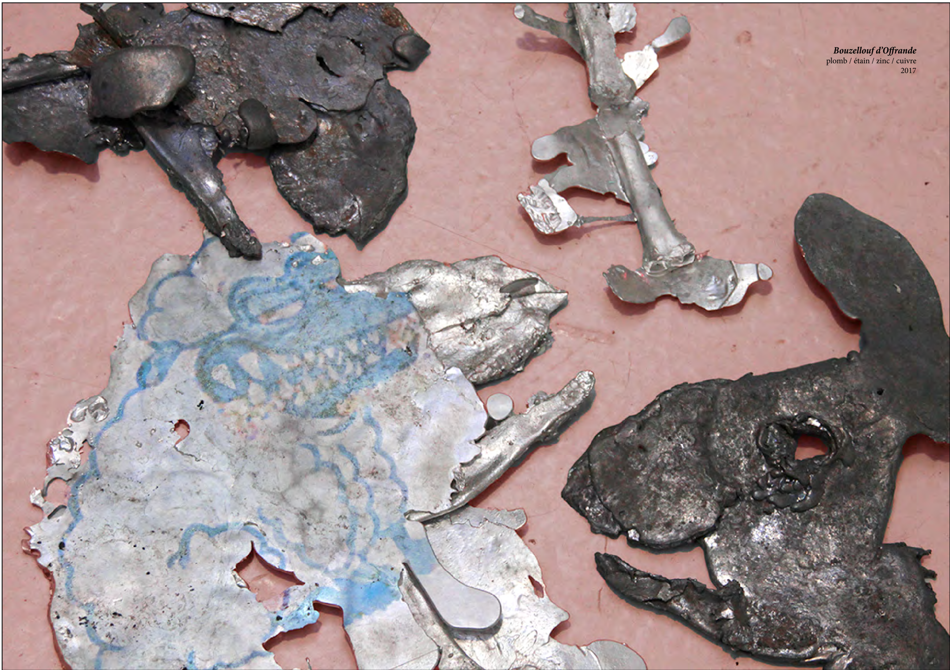
Bouzellouf d'Offrande plomb / étain / zinc / cuivre 2017