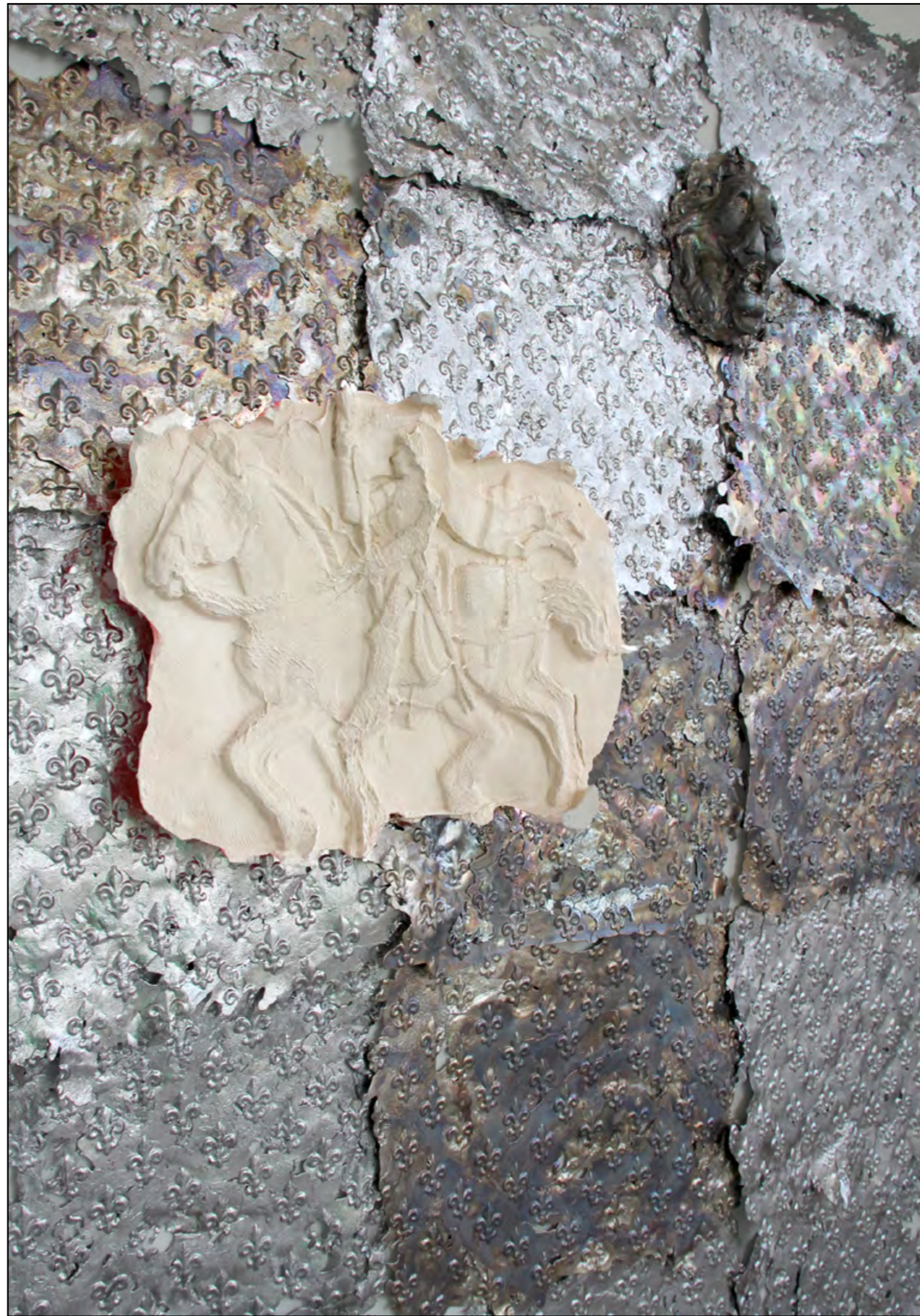
D*Arc plâtre 50x42 cm 2017