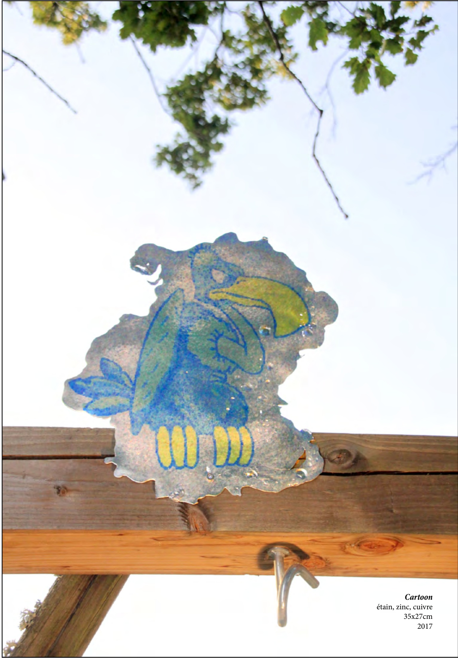
Cartoon étain, zinc, cuivre 35x27cm 2017