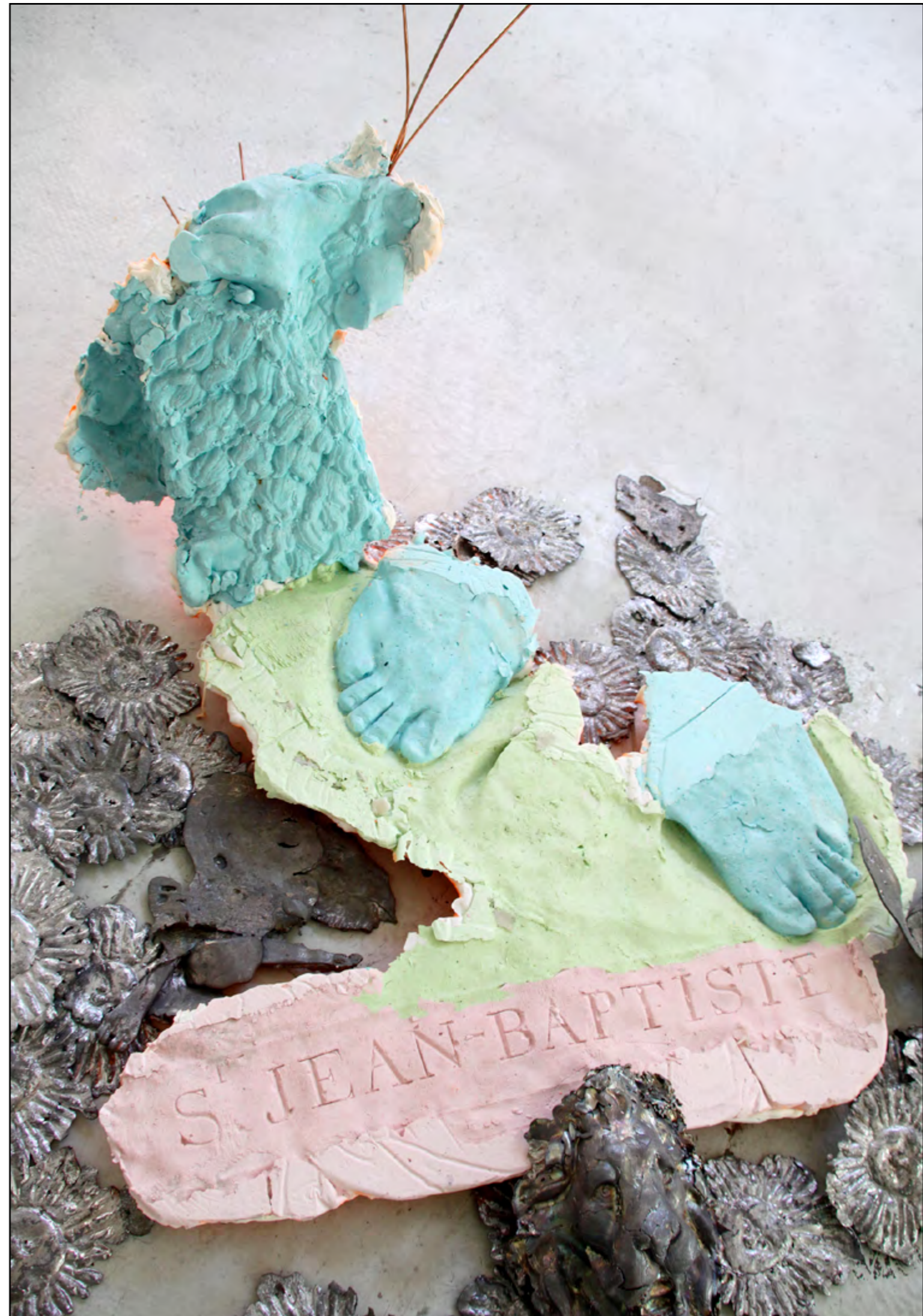
Saint*Jean-Baptiste Plomb, Plâtre, cuivre 110x80cm 2018