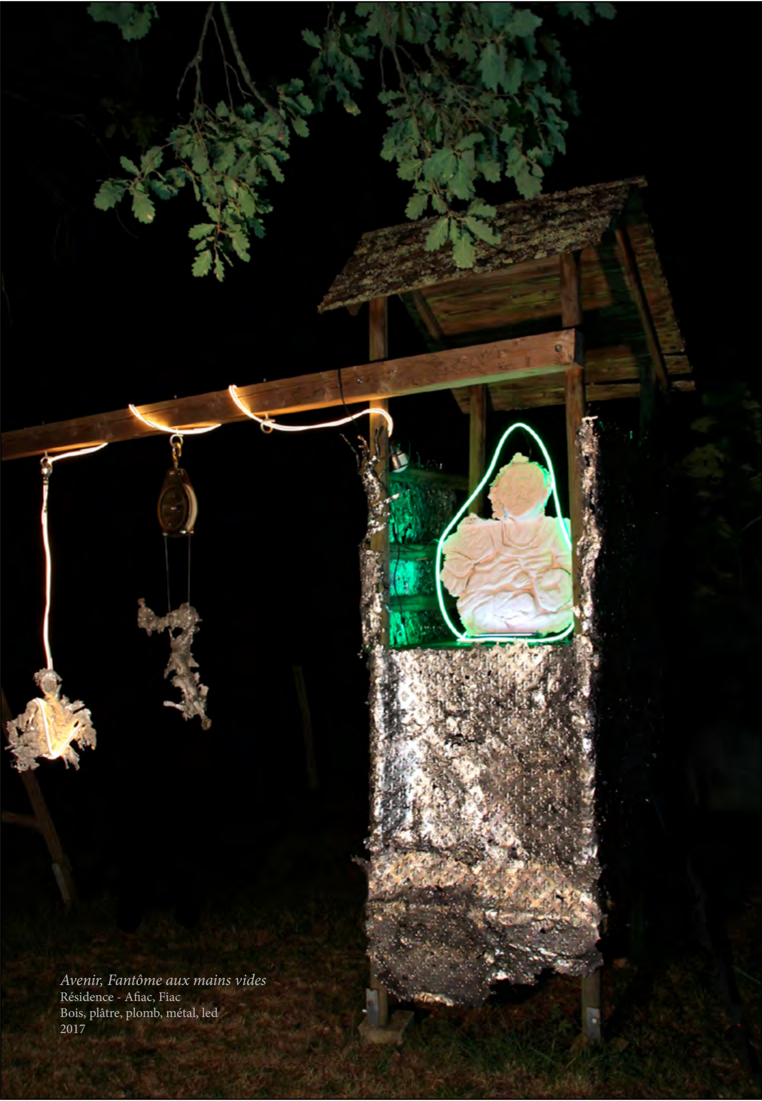
Avenir, Fantôme aux mains vides Résidence - Afiac, Fiac Bois, plâtre, plomb, métal, led 2017