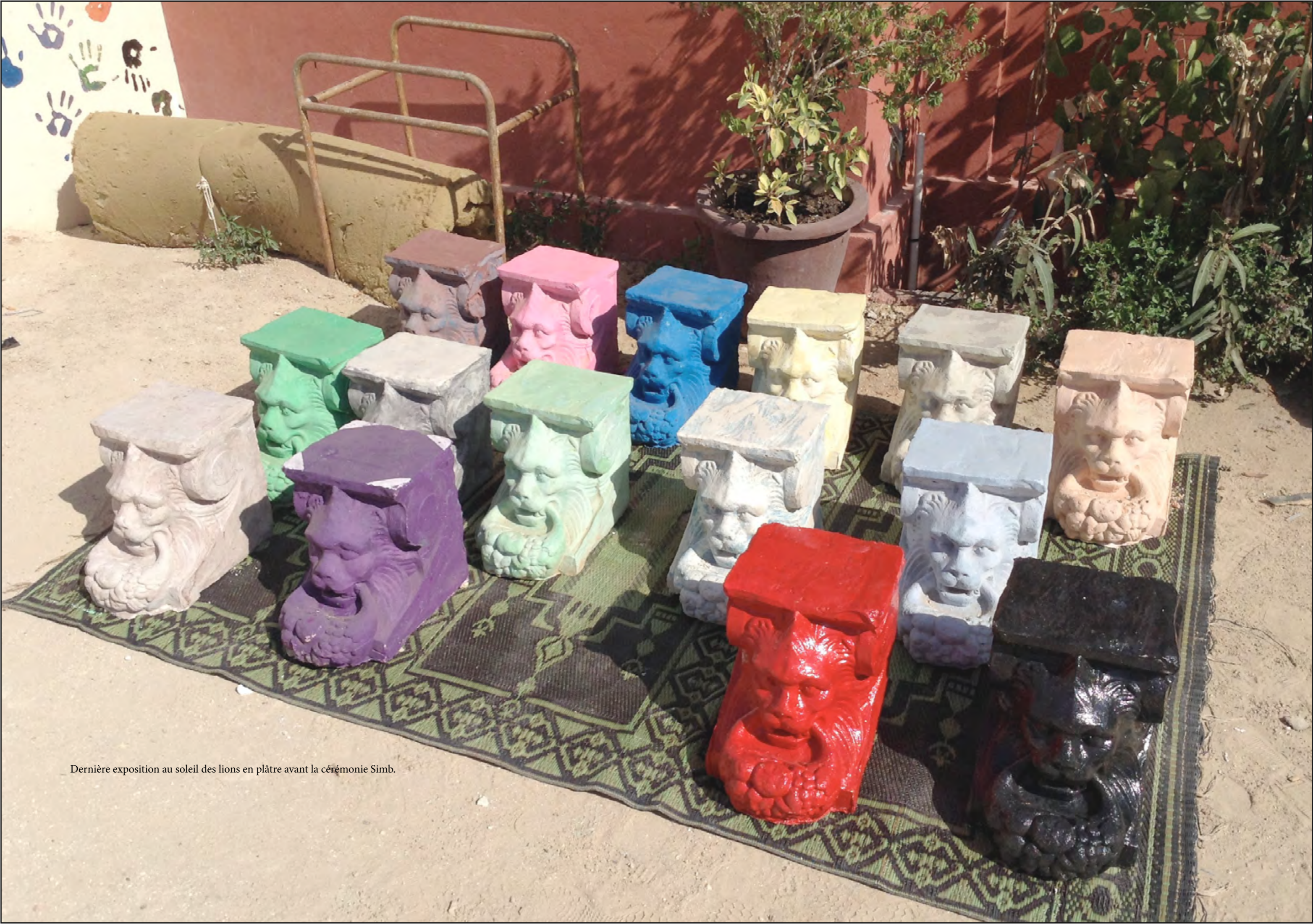
Dernière exposition au soleil des lions en plâtre avant la cérémonie Simb.