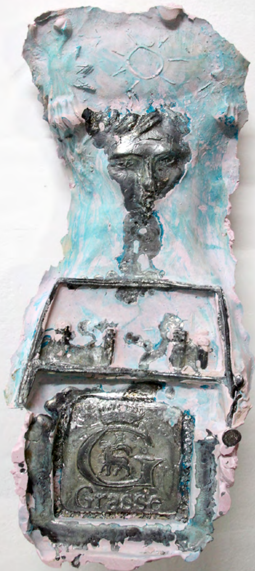
Élixir*Sauvette plomb, plâtre 45x21 cm 2018