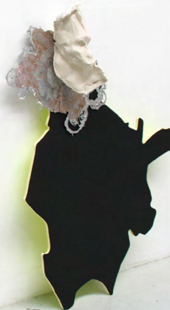
Monkey*Poppy Zinc / Étain / Cuivre / Plâtre / Bois 132x98cm 2017