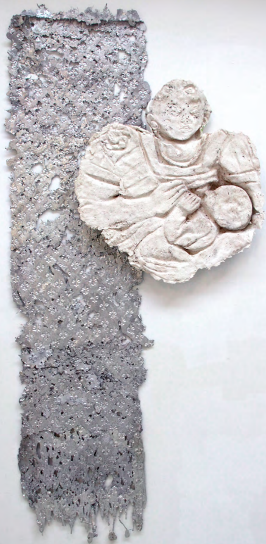
Baby*Lys Plomb, plâtre 207 x 107 cm 2017