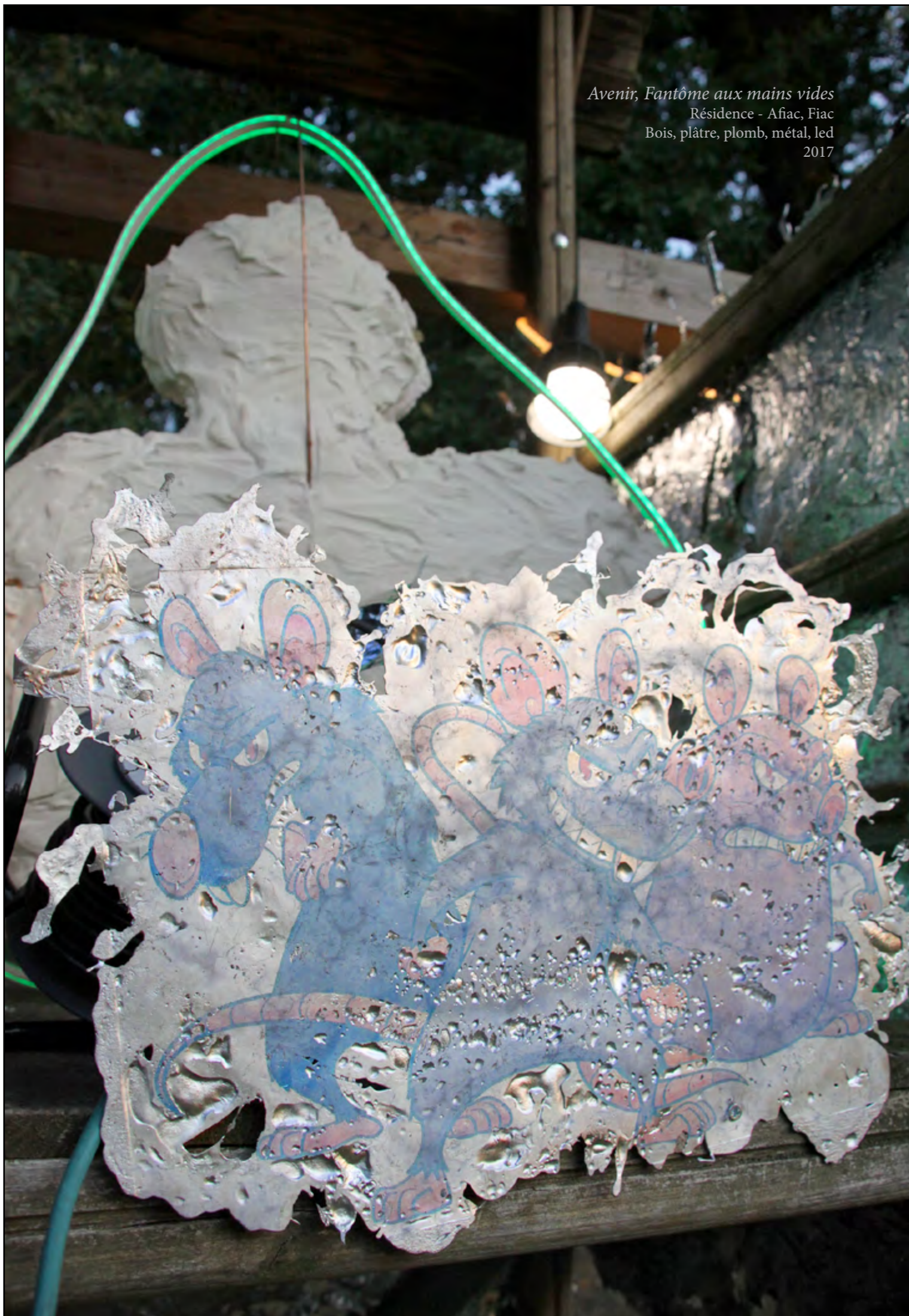
Avenir, Fantôme aux mains vides Résidence - Afiac, Fiac Bois, plâtre, plomb, métal, led 2017