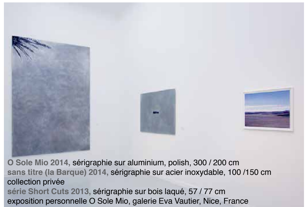
O Sole Mio 2014 , sérigraphie sur aluminium, polish, 300 / 200 cm sans titre (la Barque) 2014 , sérigraphie sur acier inoxydable, 100 / 150 cm collection privée série Short Cuts 2013 , sérigraphie sur bois laqué, 57 / 77 cm exposition personnelle O Sole Mio, galerie Eva Vautier, Nice, France