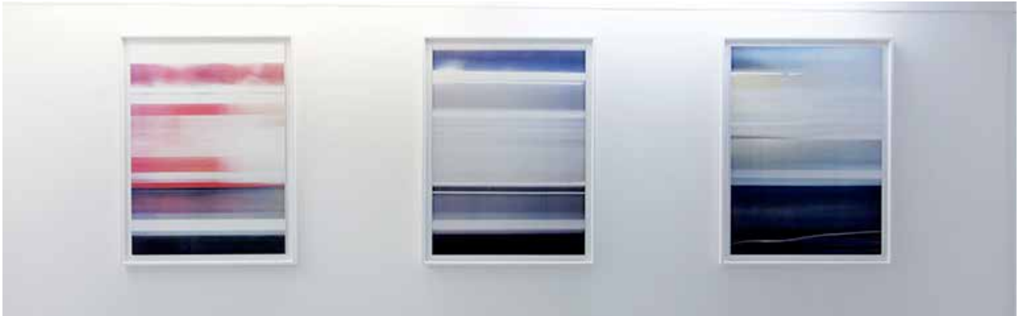
Underground (série Short Cuts) 2014 sérigraphie sur bois laqué 77 / 57 cm chaque