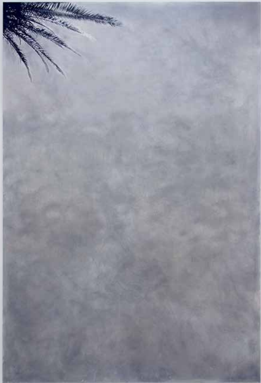
O Sole Mio 2014 sérigraphie sur aluminium, polish 300 / 200 cm