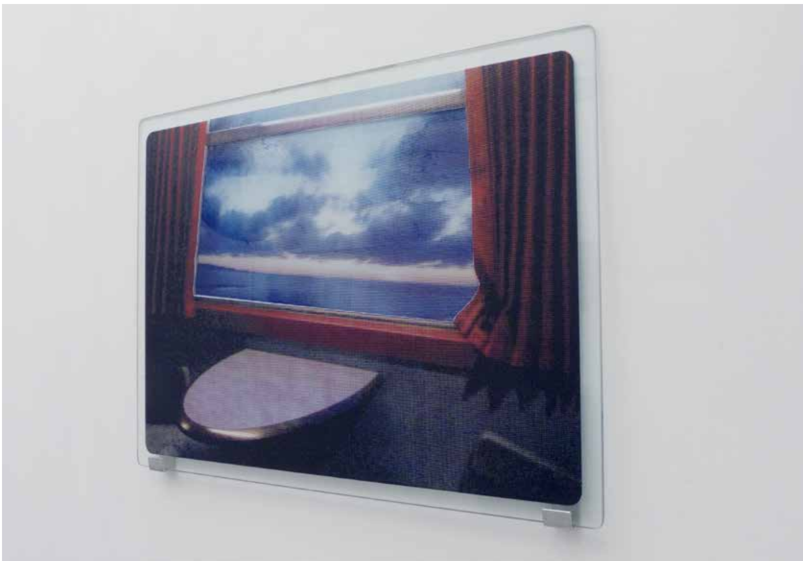
By train (série CMYK) 2012 sérigraphie sur verre recto-verso, aluminium 69/48,8 cm collection privée