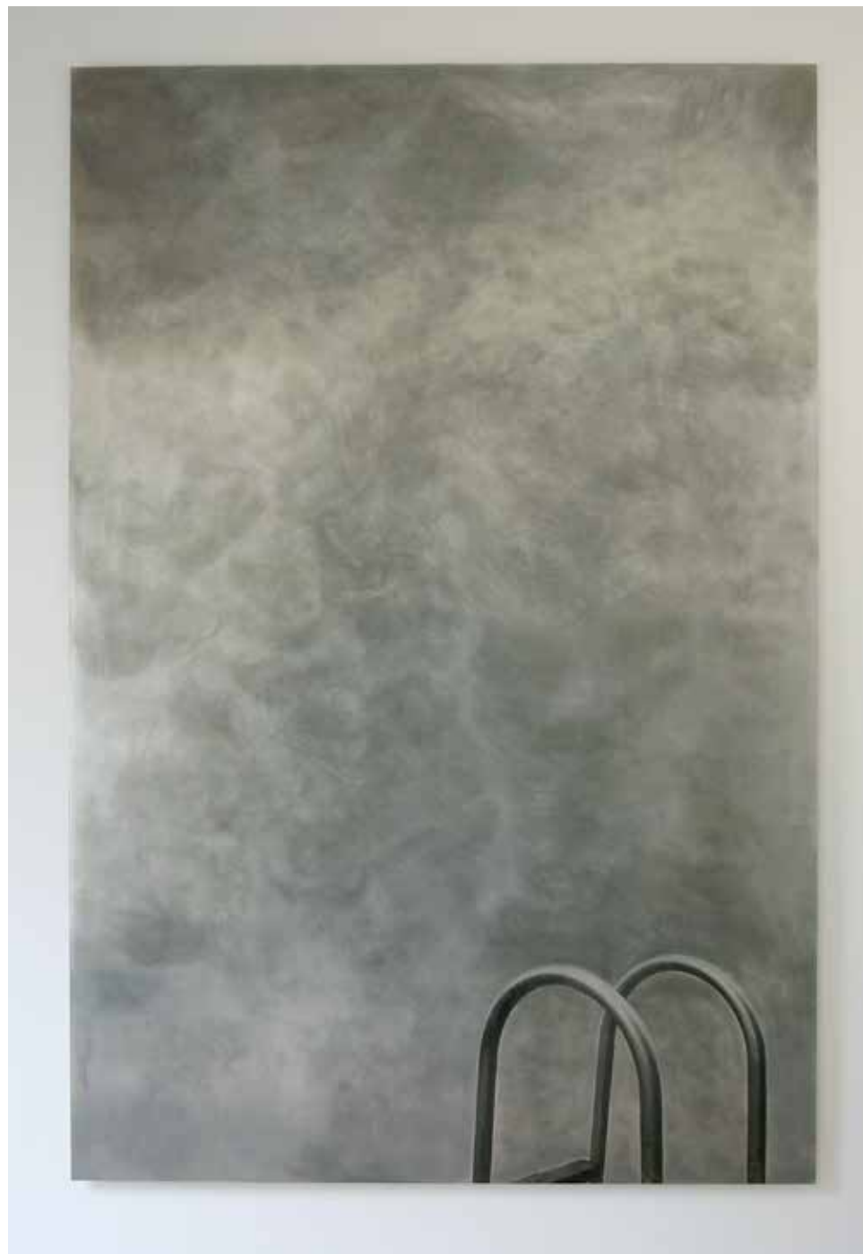
Swimming Pool 2008 sérigraphie sur aluminium, polish 300 / 200 cm collection privée