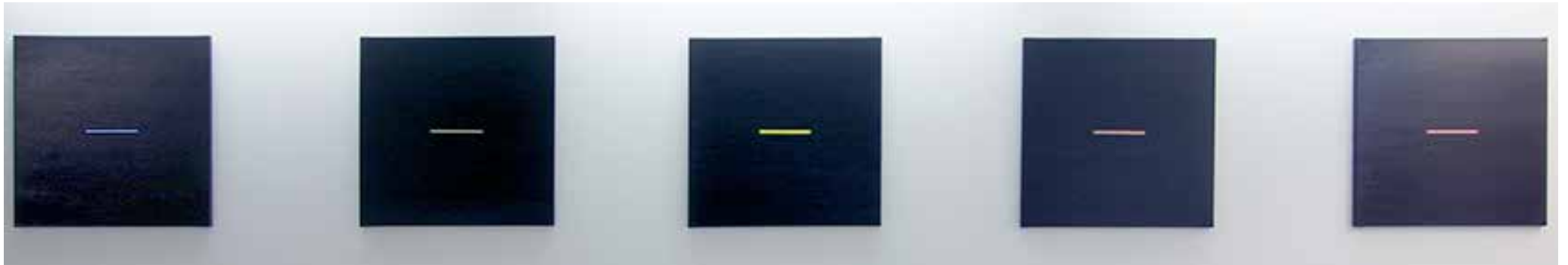
Electric city (Blue, Green, Yellow, Orange, Red) 2013 acrylique sur toile, vernis 50/50 cm chaque