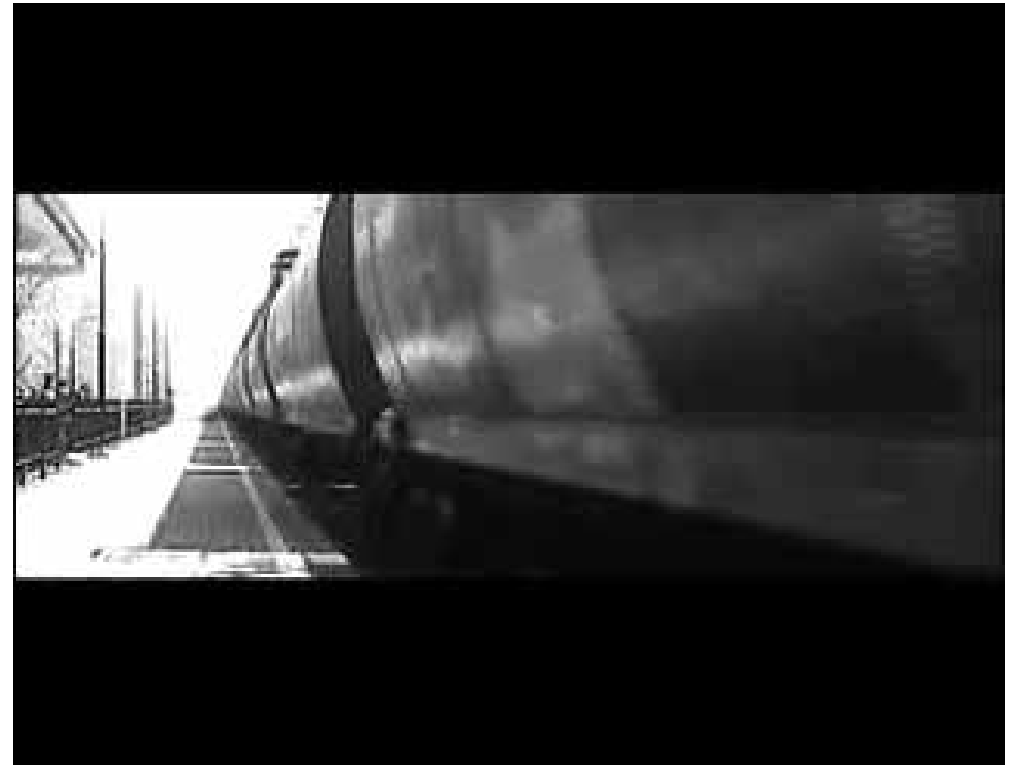
The train 2010 vidéo en boucle vues de l'exposition personnelle One way ticket, Standards, Rennes