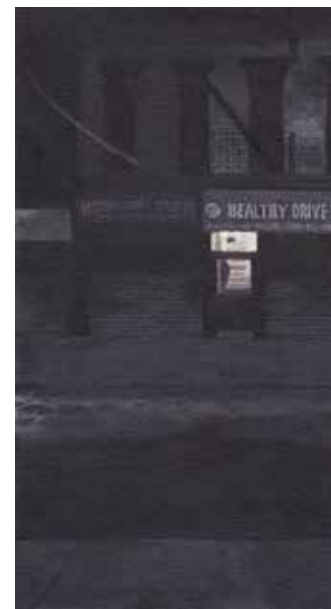
série By night 2009-2013 acrylique sur papier dimensions variables