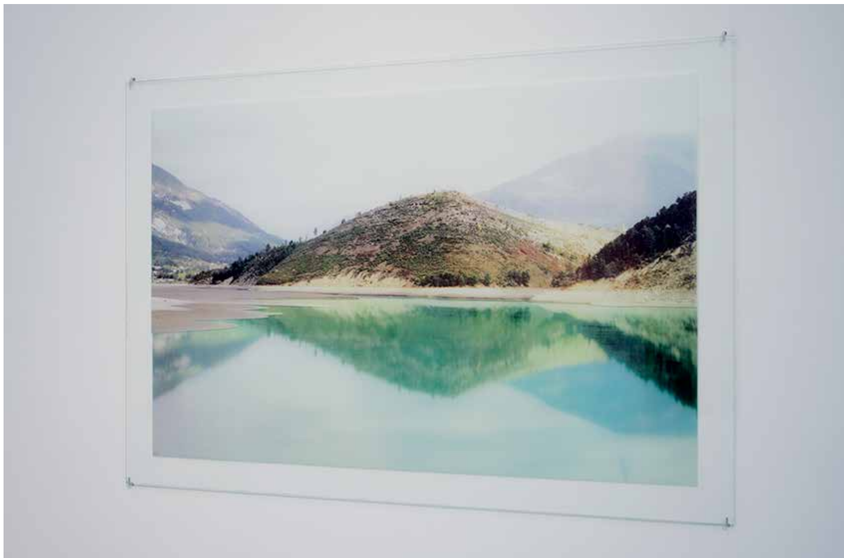
The Mountain (série CMYK) 2012 sérigraphie sur verre recto-verso 100 / 70 cm