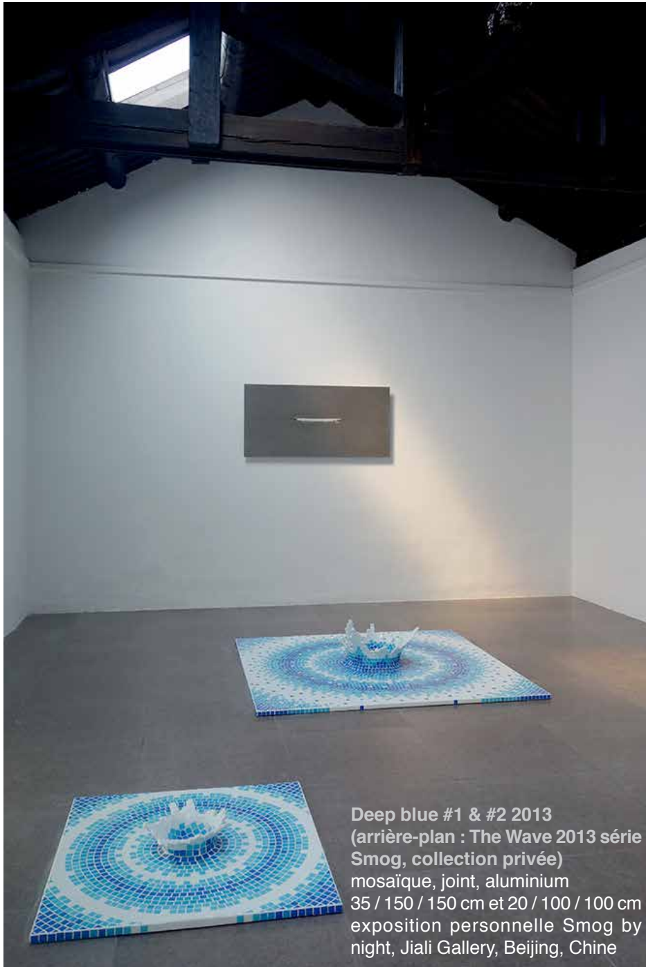
Deep blue #1 & #2 2013 (arrière-plan : The Wave 2013 série Smog, collection privée) mosaïque, joint, aluminium 35 / 150 / 150 cm et 20 / 100 / 100 cm exposition personnelle Smog by night, Jiali Gallery, Beijing, Chine