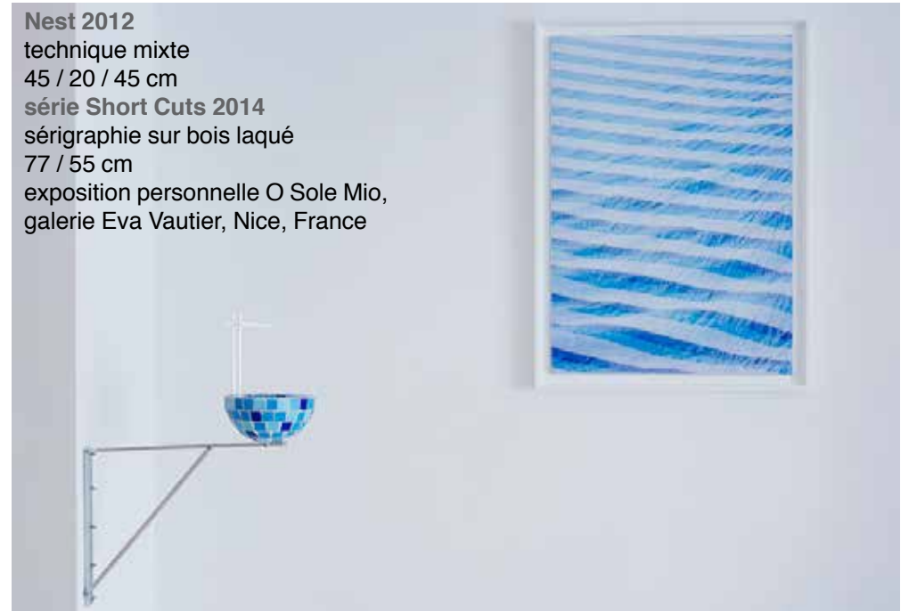
Nest 2012 technique mixte 45 / 20 / 45 cm série Short Cuts 2014 sérigraphie sur bois laqué 77 / 55 cm exposition personnelle O Sole Mio, galerie Eva Vautier, Nice, France