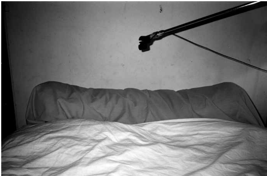
Mon lit au Barroux, en décembre 2001