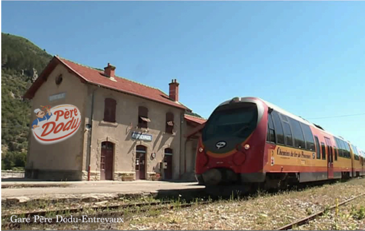
Gare Père Dodu-Entrevaux