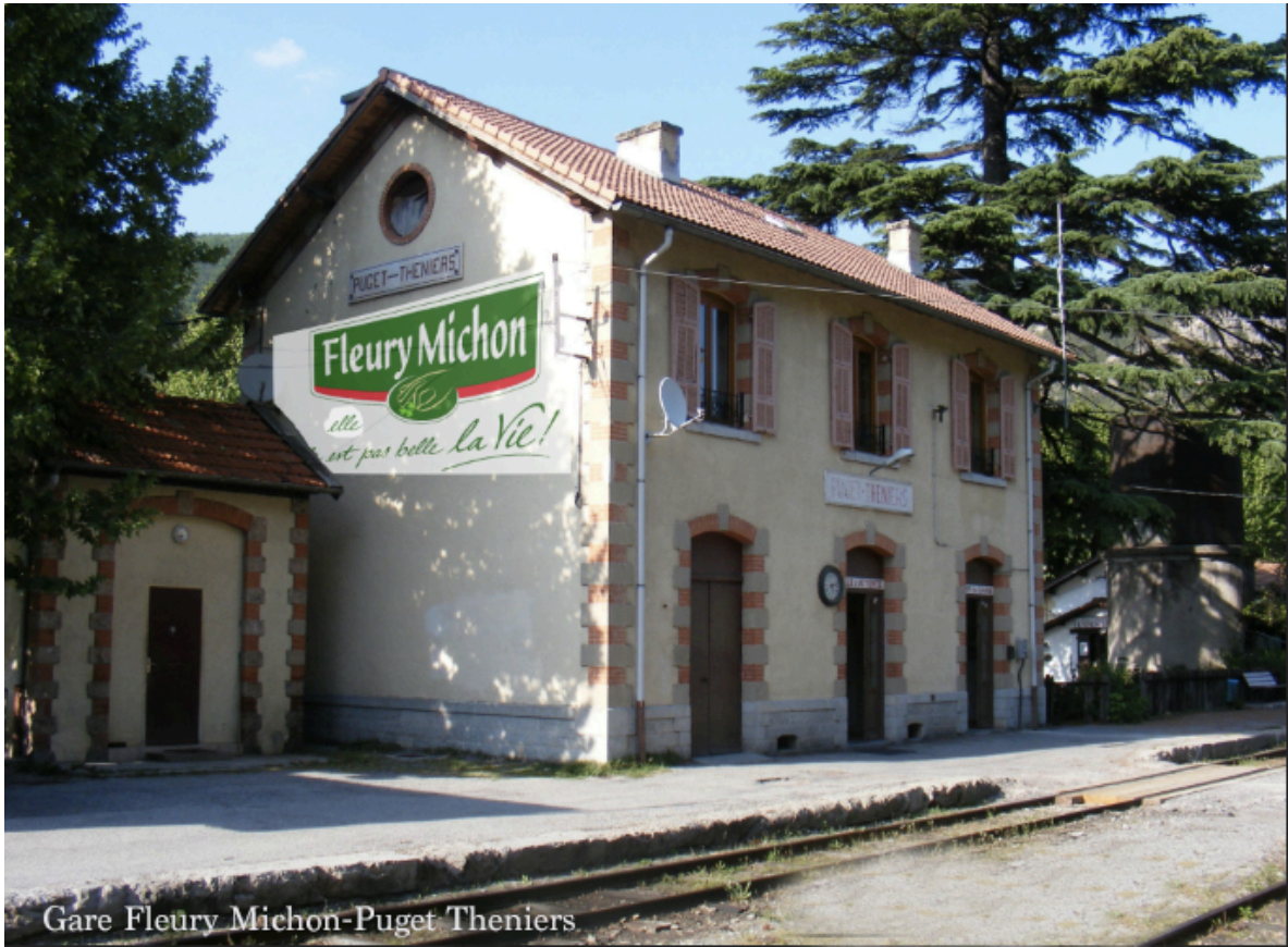
Gare Fleury Michon-Puget Theniers