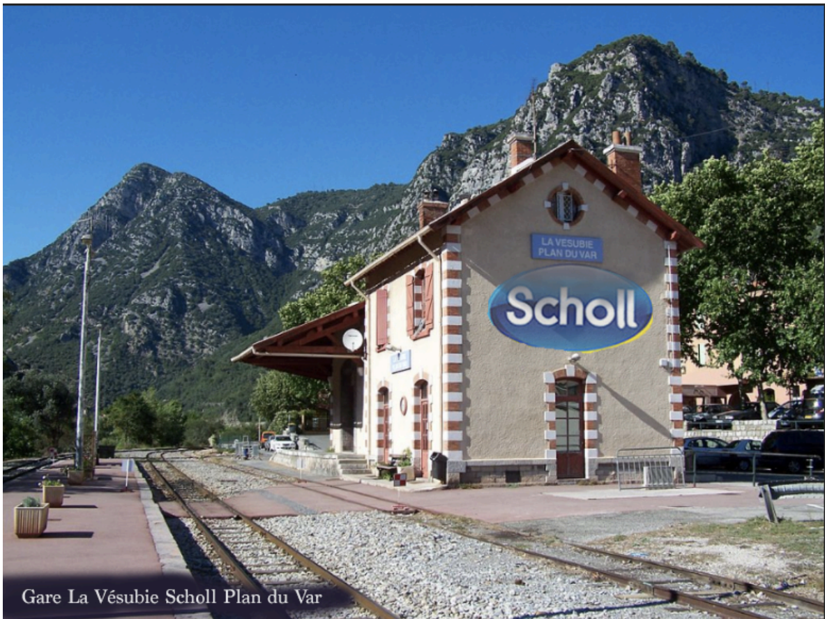
Gare La Vésubie Scholl Plan du Var