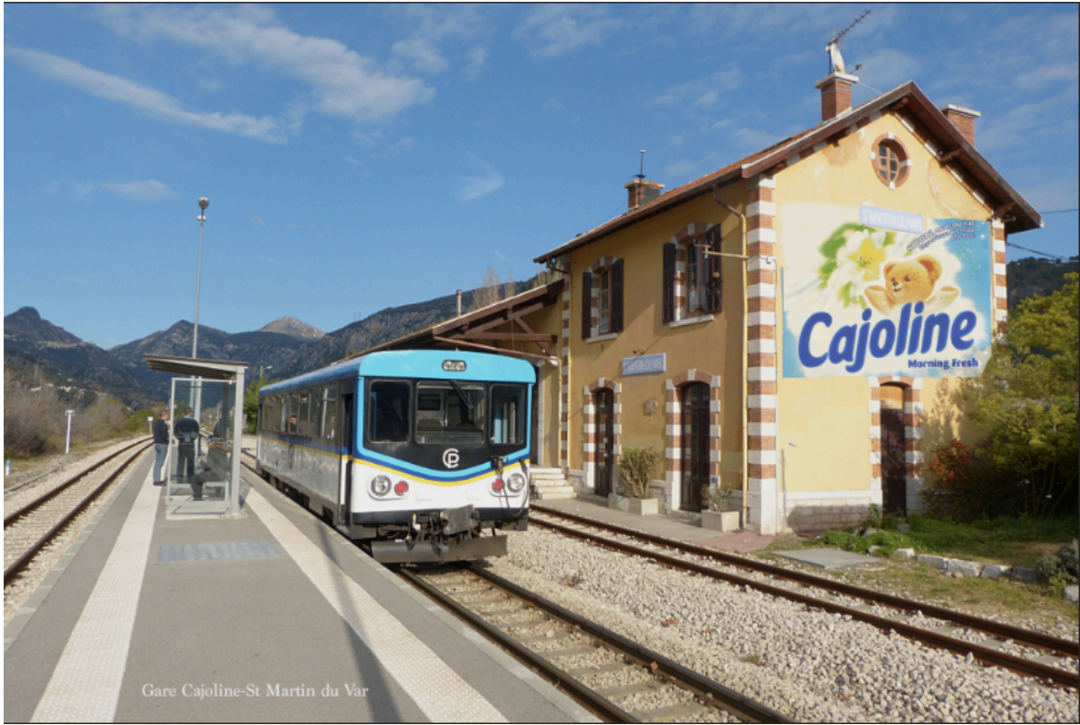
Gare Cajoline-St Martin du Var